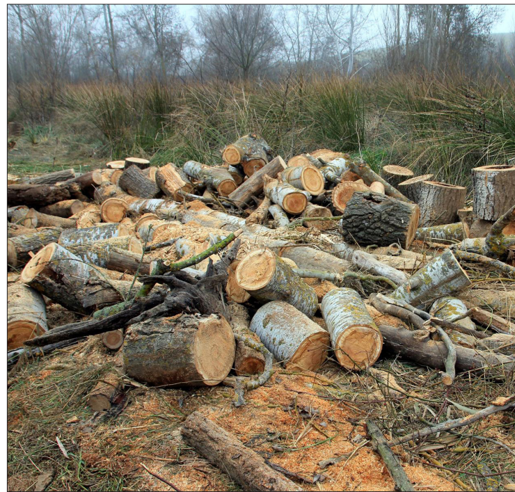
▲ La dependencia federal realizó esta semana un tercer operativo simultáneo en 14 entidades con zonas críticas forestales.

Entre las irregularidades e ilícitos encontrados están: remoción de vegetación y arbolado, extracción de materiales pétreos, des-