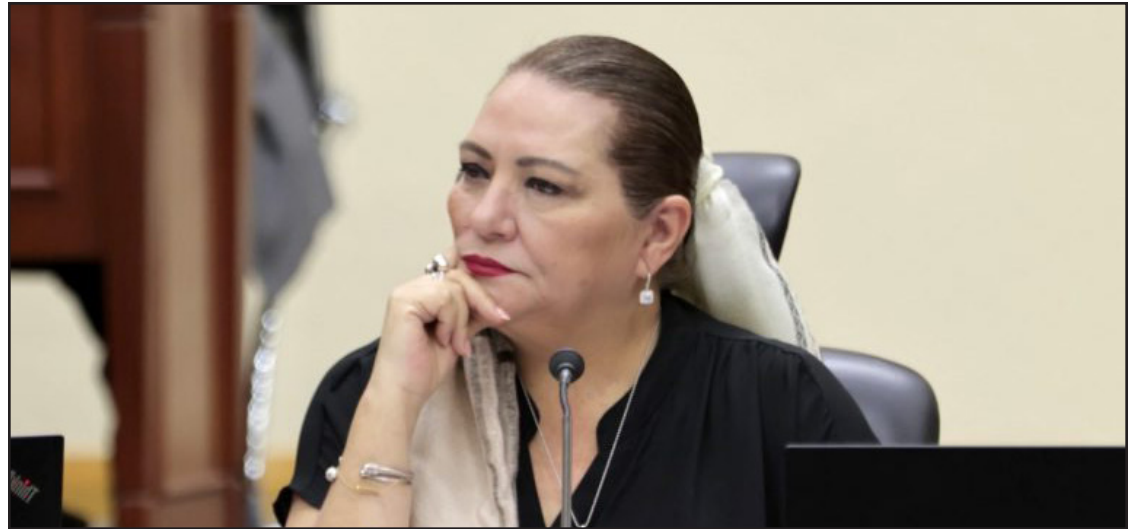
▲ La presidenta nacional Guadalupe Taddei Zavala, adelantó una posible instalación de centros de votación, pero garantizando la cobertura de todos los votantes que integran el listado nominal.

Este método implicaría la contratación de menos personal ya que a nivel nacional podrían instalarse