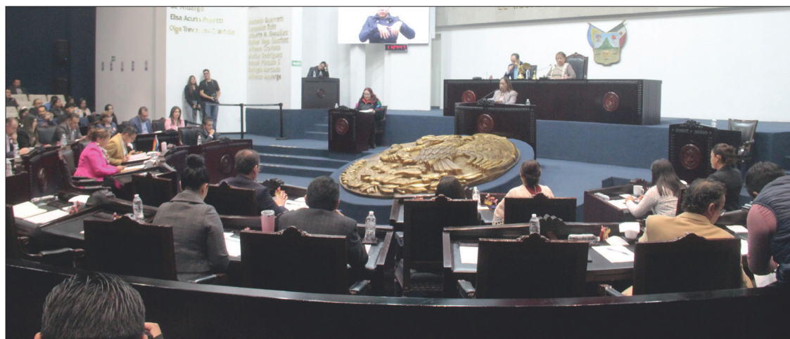
▲ El proyecto presentado por la Secretaría de Hacienda del Estado el pasado 19 de noviembre se aprobó por mayoría, con tres votos en contra de diputados del PRI y del PAN.

La Secretaría de Medio Ambiente y Recursos Naturales, 410 millones de pesos; la Secretaría