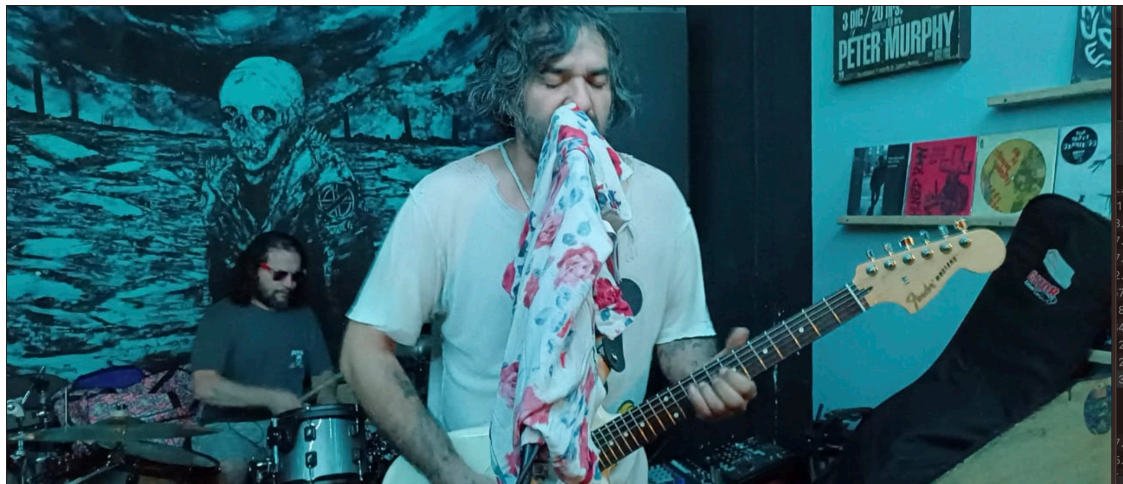
▲ Aunque para Trujillo no hay una definición exacta para ubicar el género musical de Las Cruces, por lo general expertos lo denominan entre el post-sunflower-punk-psychodelic-pop .

—Para mí, el rock siempre ha sido más que un género; es una forma de expresión y de hacer cosas genuinas. No se trata de competir con la música que surge ahora, sino de seguir creando desde el corazón.