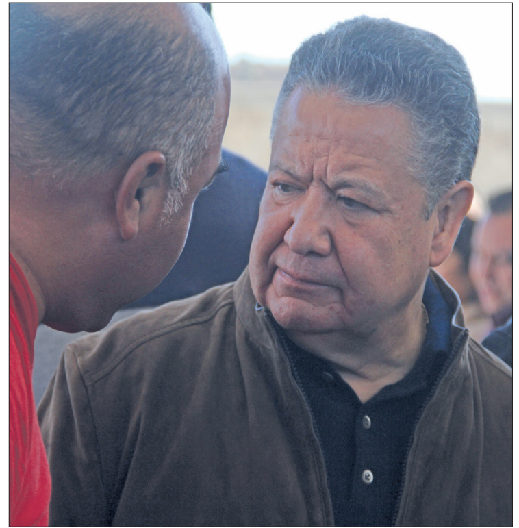
▲ El mandatario dijo que tiene confianza en el secretario, ya que “es un funcionario de primer nivel que me ha acompañado durante muchos años”.

“Y desde luego que también significa una posibilidad turística y cultural muy importante para el estado; entonces, haremos lo que nos corresponde, porque es un área federal (donde se encuentra la pirámide), y pues estaremos muy atentos”, refirió.