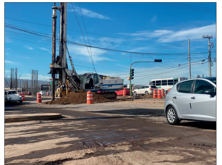
▲ Los trabajos fueron anunciados el pasado 29 de noviembre en la visita del gobernador a Tulancingo.

Dichos trabajos iniciarán el próximo 26 de diciembre y terminarán el 28 de febrero de 2025.