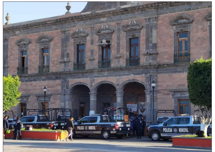
▲ La mujer fue puesta a disposición de la Fiscalía y las autoridades especiales le brindaron apoyo.

Las autoridades han iniciado las investigaciones correspondientes para esclarecer las circunstancias de su desaparición.