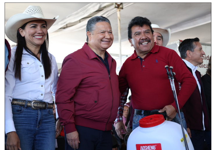
▲ La gira de trabajo “Rutas de la Transformación, Gobierno en Movimiento Feria de los servicios” se llevó a cabo este viernes en el municipio de Singuilucan.

“En este proceso de transformación nuestra obligación es darle claridad, transparencia al recurso público y utilizarlo bien, y que esté en sus manos de la población la crítica, que tengan la información, esa es una comunicación directa entre el gobierno y la población”, puntualizó el gobernador.