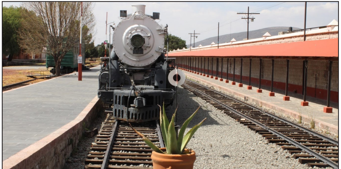
▲ Se necesita brindar mantenimiento de maquinaria y equipo de los inmuebles en el Cuartel del Arte, la Biblioteca Ricardo Garibay y Centro Cultural del Ferrocarril en Pachuca.

mantenimiento del hidroneumático en el Museo del Ferrocarril.