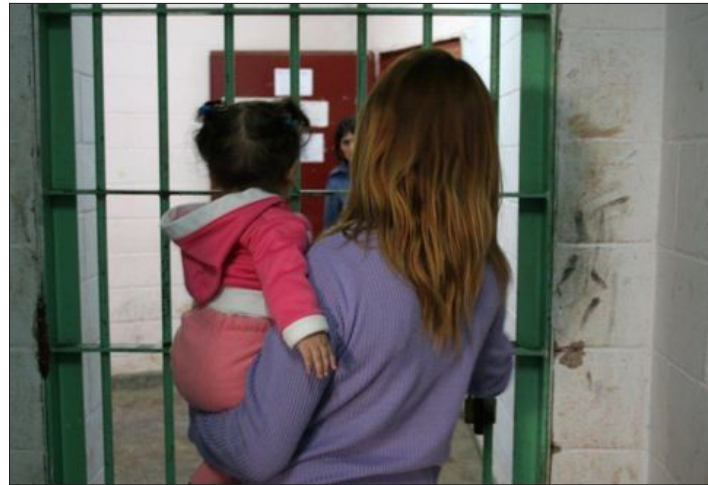
◀ Autoridades deberán emitir protocolos para los menores que acuden a visitar a sus familiares en reclusión.