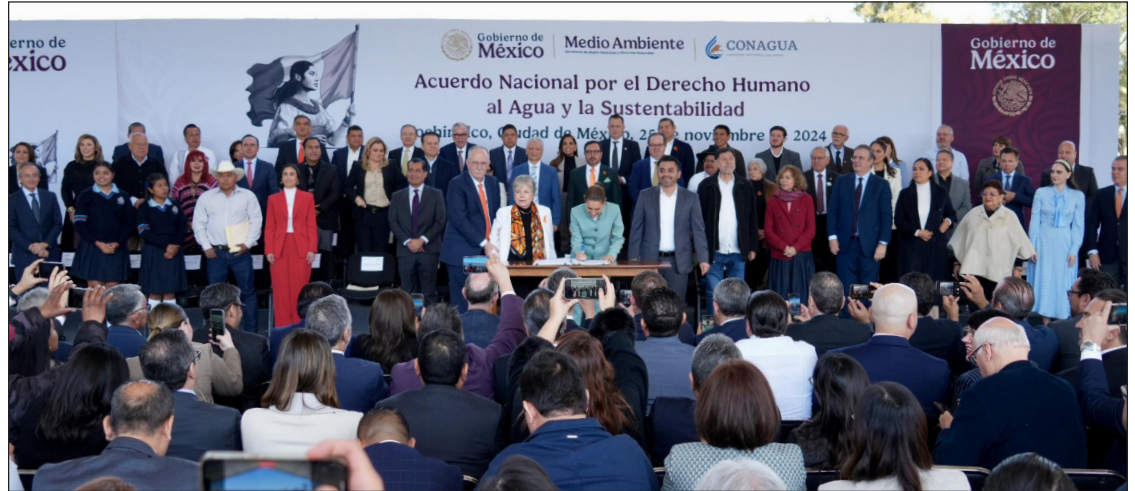
▲ “No podemos ser la doceava economía del mundo y tener los ríos más contaminados del mundo. (sic)”, planteó ante mandatarios estatales la presidenta Claudia Sheinbaum.

“No podemos ser la doceava economía del mundo y tener los ríos más contaminados del mundo, debemos cumplir la norma y destinar los recursos suficientes para que haya salud, y que el agua de los ríos tenga los servicios ambientales que requiera y pueda ser usado para consumo humano. Hemos destinado tres ríos que han sido trabajados desde hace años, pero que no se ha hecho de manera integral”, acotó.