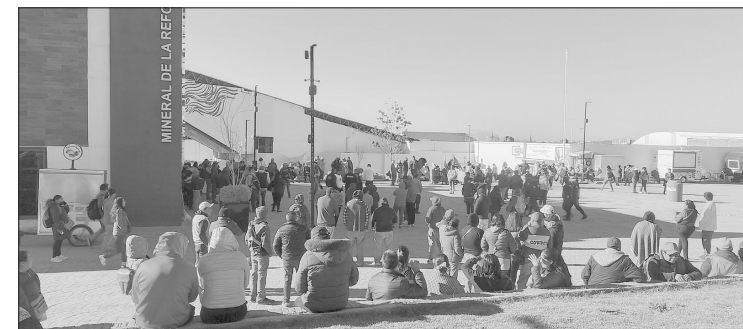
▲ Comerciantes se manifestaron frente a la presidencia municipal de Mineral de la Reforma.

Para garantizar la seguridad de los quejosos y de los trabajadores de la alcaldía, elementos de la Secretaría de Seguridad Pública municipal estuvieron presentes en el lugar para supervisar el desarrollo de la manifestación.