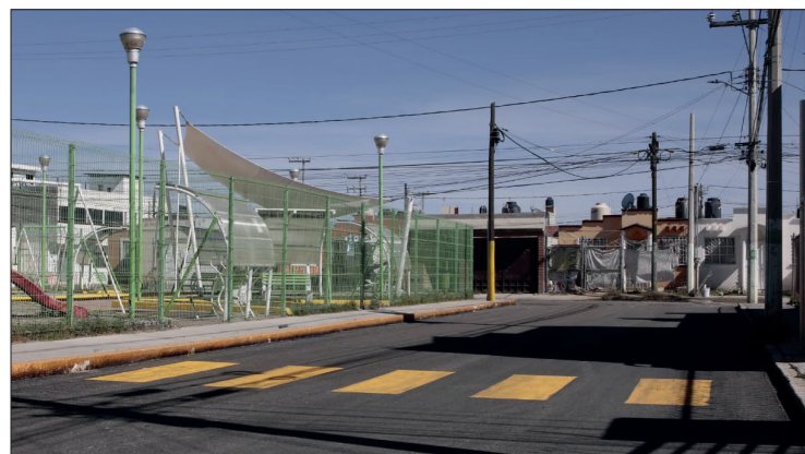
▲ El asfalto fue donado por la empresa estatal, tras gestiones realizadas por la Secretaría del Despacho.