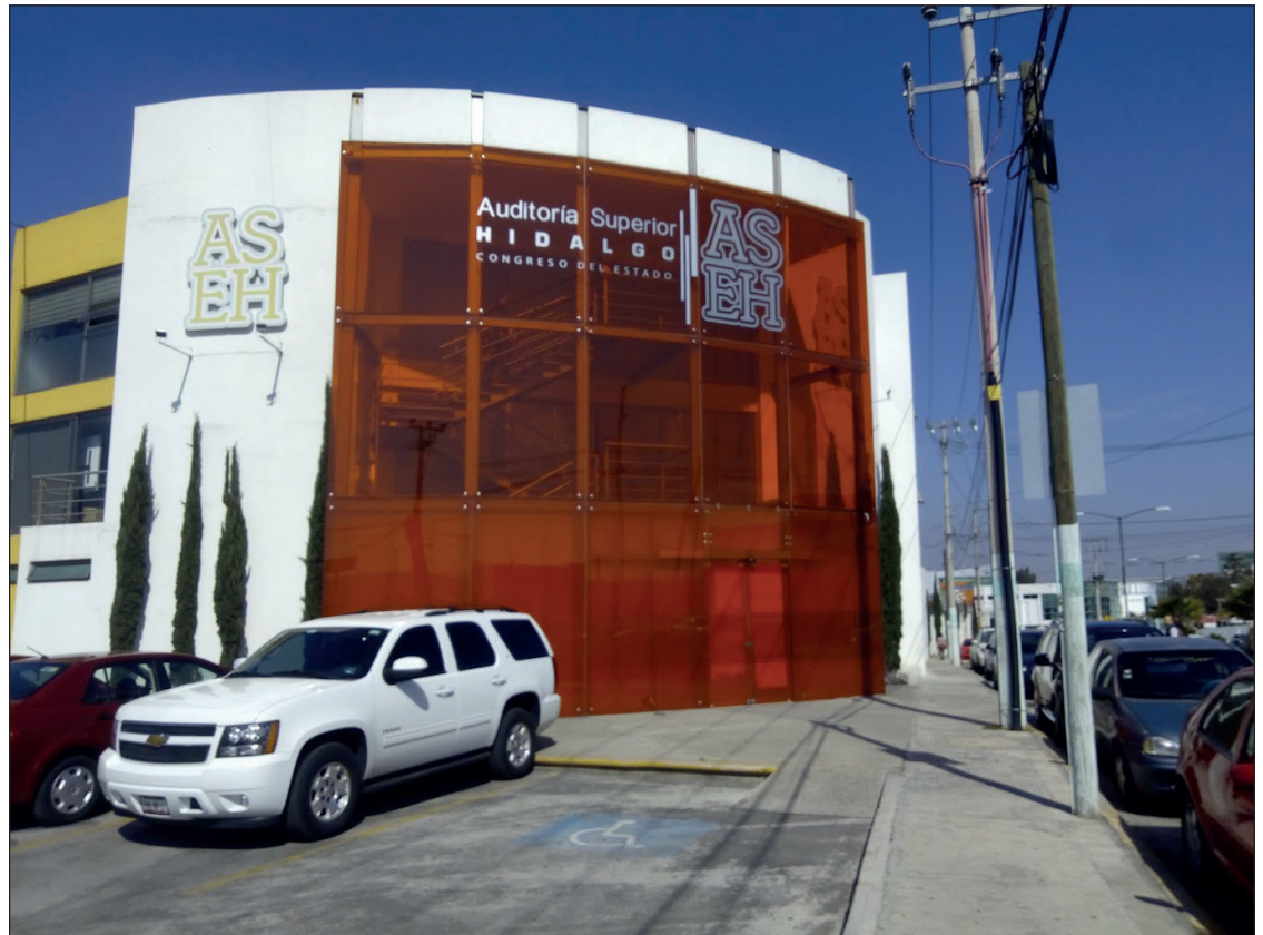
▲ De la cuenta 2019 fue archivada una carpeta contra Pachuca por 25.3 millones de pesos, debido a la falta de elementos.

De la cuenta 2021, a Ixmiquilpan se le cerró el caso por acuerdo y archivo por falta de elementos por 2 millones 289 mil 472.30; del ejercicio 2020, Atlapexco también libró el proceso por 932 mil 869.44 pesos; en Lolotla se declaró concluido por acuerdo de archivo al no cumplir con los presupuestos legales y procesales para promoción de responsabi-