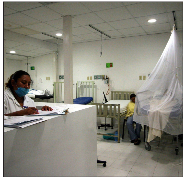
▲En lo que va del año, mil 606 personas han sido contagiadas.

Para no dejar que el mosquito transmisor de esta enfermedad se reproduzca, las autoridades sanitarias recomiendan a la población lavar, tapar y eliminar objetos que acumulen agua.