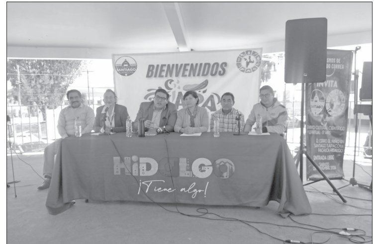
▲ Los organizadores informaron que el evento será gratuito.

Las actividades comenzarán a las 17:00 horas con una conferencia doble sobre los temas de ovnis del Pentágono y las fuerzas aéreas y las momias de Nazca. Después, habrá pláticas sobre la mitología de las constelaciones,