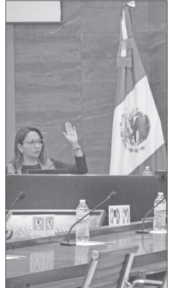
▲ El Consejo General del IEEH aprobó los diseños, con y sin emblemas.

Dichos insumos electorales serán utilizados tanto en la jornada como en la Sesión Especial de Cómputo Municipal, a través de la cual el IEEH deter-