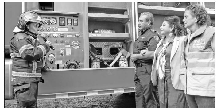
▲ La mandataria resaltó en especial a las 392 mujeres de esta institución.

Entre las unidades nuevas, hay cinco bombas contra incendios, cuatro autotanques y dos vehículos de primera respuesta, se suman a los 282 vehículos ya existentes, elevando el total a 293 unidades.