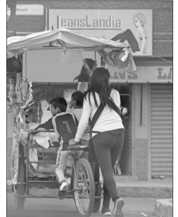
▲ El sueldo promedio de un menor es de mil 200 pesos semanales.

Basado en los resultados, de acuerdo con el ayuntamiento, se elaborarán políticas públicas municipales para erradicar esta situación creciente y, en un momento dado, ofrecer otras alternativas, a fin de que las familias no trunquen oportunidades a niños y adolescentes que dejan los estudios para