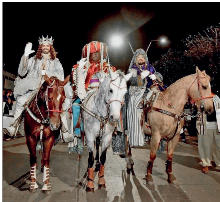
▲ Durante la festividad se podrán admirar 19 carros alegóricos alusivos a series, películas y caricaturas familiares.

Se llevarán a cabo en los municipios de Ixmiquilpan, Tulancingo, Pachuca y Huejutla