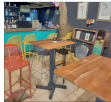
▲ A través de las redes sociales, Mango Records dio a conocer el saqueo del que fueron víctimas.

El establecimiento ofreció una recompensa a quien dé información para recuperar los bienes