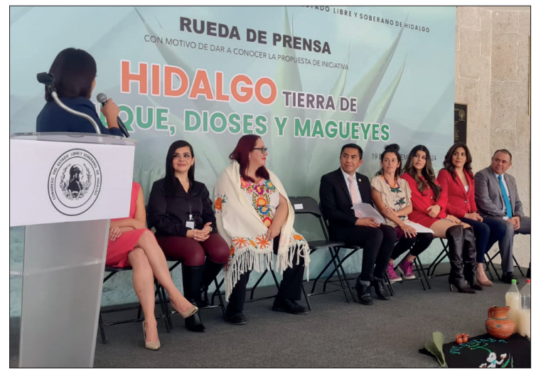
▲ En rueda de prensa explicaron que en Hidalgo el pulque se produce en 73 de los 84 municipios.

Los legisladores pretenden la preservación del procedimiento con el Plan de Salvaguardia