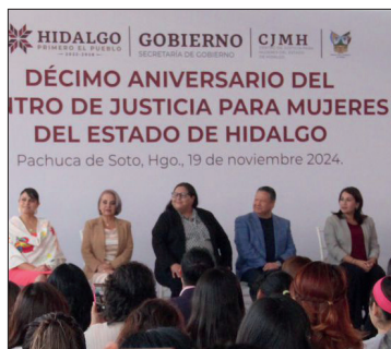
▲ Se realizó el acto protocolario por el 10 aniversario del Centro de Justicia para las Mujeres de Hidalgo.

Enfatizó que “ninguna ley, ninguna sentencia, podrá otorgarnos una solución completa o una prevención efectiva si no trabajamos de fondo esta problemática. No podemos ver la violencia en contra de las mujeres como hechos aislados, encuadrados en delitos o senten-