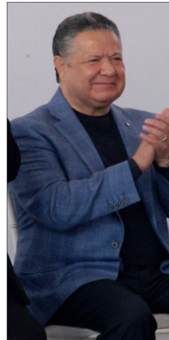
▲ El gobernador aseguró que se generaron las condiciones para que siga la actividad minera en paz y tranquilidad.

En ese sentido, aseguró que llegarán hasta donde sea, así sea per-