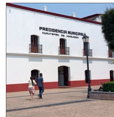
▲ Este martes fue el primer ejercicio, con miras a la renovación del ayuntamiento de Cuauhtémoc. Foto Especial

No participaron los candidatos a sindicaturas y regidurías del PAN y del Verde Ecologista de México.