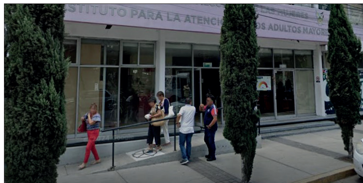
▲ La ASEH detectó que el instituto no cuenta con los mecanismos de control adecuados.

de 2024, que se llevó a cabo dentro de las instalaciones que ocupa el Instituto, se detectó que 18 equipos de cómputo portátiles, por un importe asignado mediante el resguardo número 134, fueron sustraídos, por lo que se encuentran bajo el proceso de la