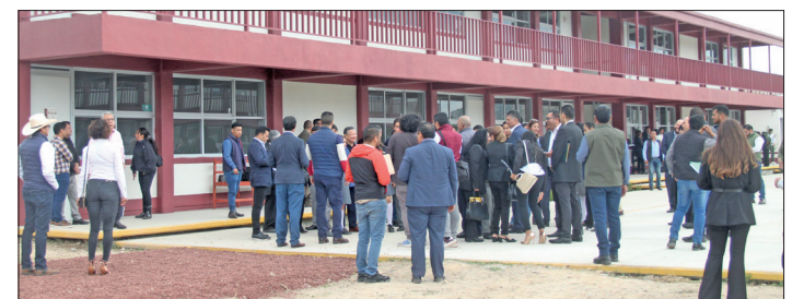
▲ El Cobahh deberá aclarar el destino de 690 mil 835.71 pesos.

NO PODEMOS EXIMIR a los gobernadores, presidentes municipales, así como al Poder Judicial. De su responsabilidad en temas de seguridad. Solo comprometiéndose de manera conjunta los tres niveles de gobierno y los tres poderes de la nación a trabajar en coordinación, con estrategias objetivas, planes de acción contundentes y evitando la corrupción, lograremos combatir de manera eficiente la inseguridad que existe en nuestro país.