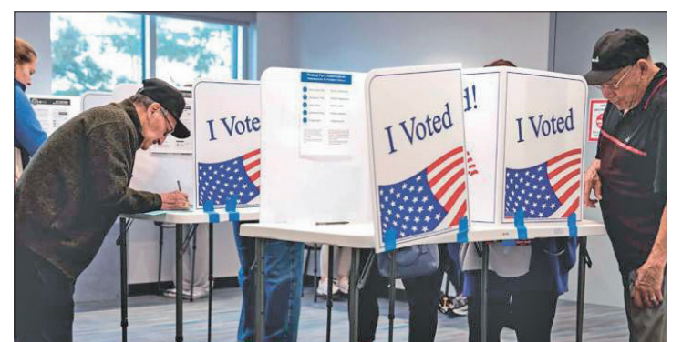
▲ Las últimas encuestas muestran una carrera reñida entre la demócrata y su contrincante republicano.

A menos de 48 horas de las votaciones, la vicepresidenta argumentó que la elección ofrece a los votantes la oportunidad de rechazar el "caos, el miedo y el odio", mientras que el expresidente repitió mentiras de fraude electoral para intentar sembrar dudas sobre la integridad de la votación y sugirió que el país se desmorona sin él en el cargo.