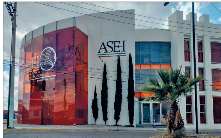
▲ Las irregularidades se encuentran en el área jurídica de la Auditoría Superior del Estado.

Por irregularidades financieras de diferentes secretarías observadas de la Cuenta Pública 2022