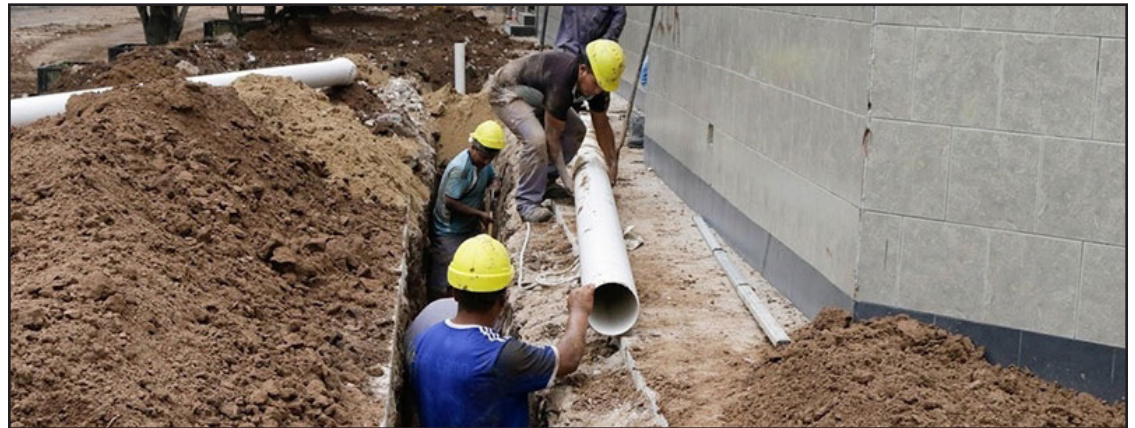
▲ Los datos de la ENEC arrojan que el porcentaje va en descenso, pues un mes antes la entidad registró el 0.9% en valor de producción.

El Inegi desglosa que Hidalgo fue el segundo estado, al igual que Colima, Quintana Roo, Tlaxcala y Zacatecas, que en agosto menos produjeron obras de agua, riego y saneamiento