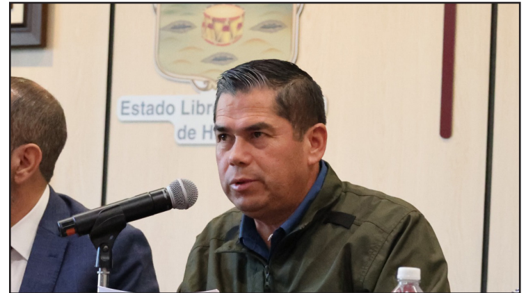
▲ El gabinete de seguridad dio a conocer los avances en las investigaciones de los hechos delictivos registrados en últimos días.