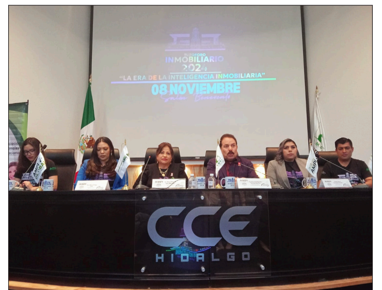
▲ Actualmente, 23 cámaras y asociaciones conforman el Consejo Coordinador Empresarial de Hidalgo.

Sánchez Ramírez dijo que esperará el desarrollo del proceso y si se registra alguna otra planilla, “es nada más que mis compañeros lo decidan (...), si alguien tiene la posibilidad de hacerlo y cumplir con los requisitos estatutarios”, comentó.