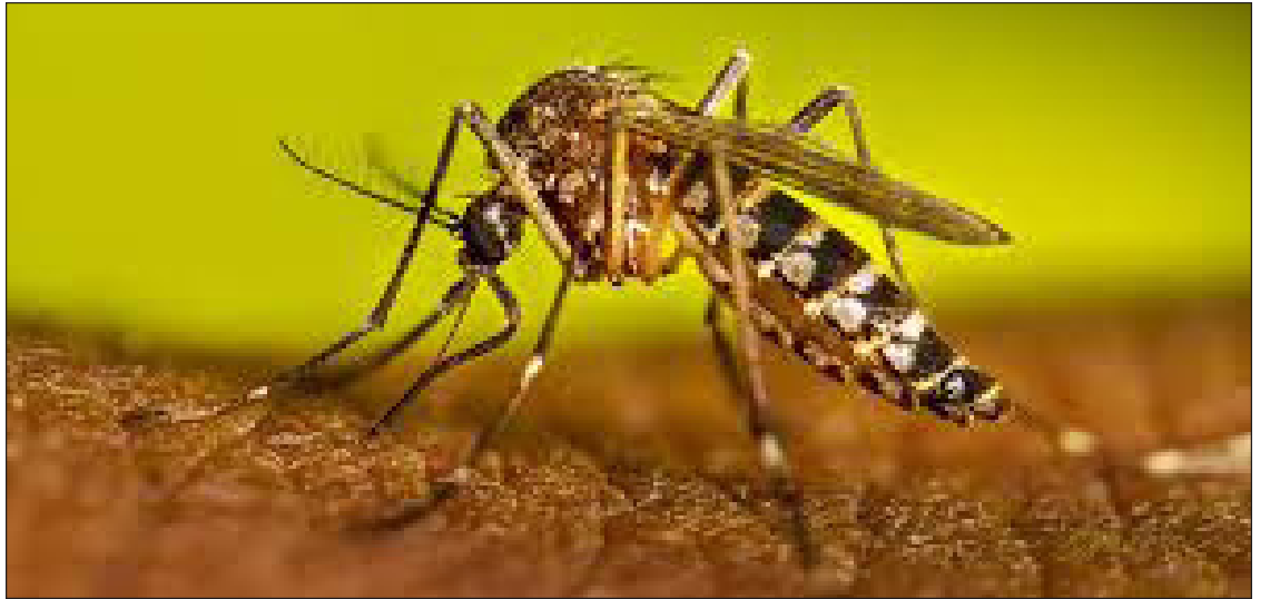
▲ El reporte oficial indica que los municipios con más casos son Atlapexco, Huazalingo, Jacala de Ledezma y Zimapán.

Por lo que septiembre se convirtió en el periodo más crítico, con el mayor número de casos de esta enfermedad en lo que va del año. Cifra en un mes casi similar