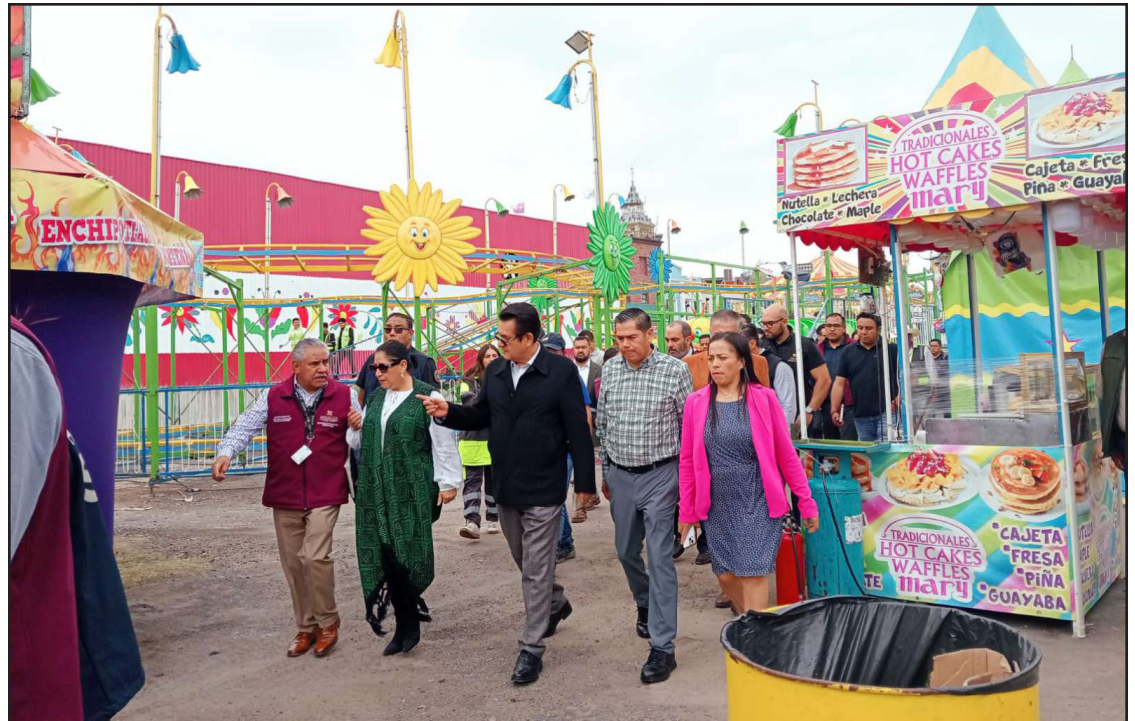
▲ Los secretarios de Gobierno y de Seguridad Pública realizaron un recorrido en las instalaciones para verificar las condiciones de estas atracciones.

De acuerdo con Quintanar, el accidente del pasado martes fue consecuencia de una falla en un tornillo y aunque no hubo personas lesionadas de gravedad dijo que una madre y su hija sí permanecieron en observación médica varios días. Defendió y confió en el trabajo de la empresa a la cual calificó