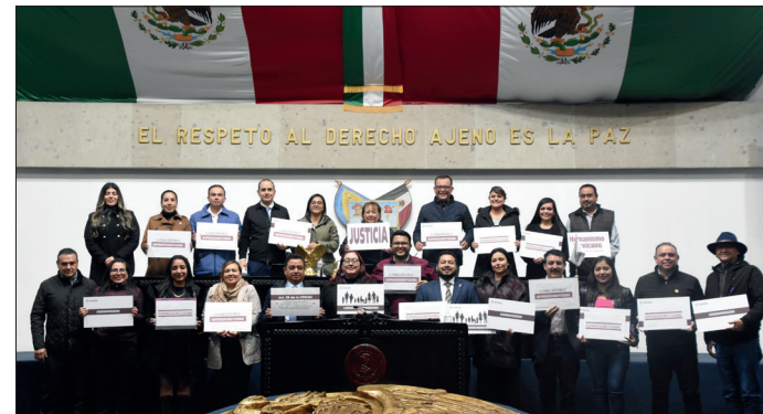
▲ Los diputados de Morena y Nueva Alianza aseguraron que se protege a la Constitución de una posible intervención del Poder Judicial.

En la misma sesión, los legisladores avalaron las reformas a los artículos 4 y 27 de la Constitución Política de los Estados Unidos Mexicanos, en materia de bienestar, cuyo objetivo es reducir la edad de las personas adultas mayores de 68 a 65 años para obtener la pensión no contributiva, garantizando el acceso a un ingreso básico que mejore su calidad de vida y fortalezca su autonomía.