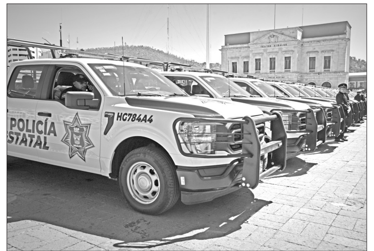
▲ A través de diversos operativos, se aseguraron poco más de tres millones de litros de combustible.

Con la creación de la Policía Violeta, se brinda "atención, protección y acompañamiento a víctimas de delitos que requieren de una intervención especializada". Además, se destacó la creación de la Unidad Especializada de Policía y Tránsito en la zona metropolitana de Pachuca para mejorar la seguridad en las carreteras y vialidades de esta región.