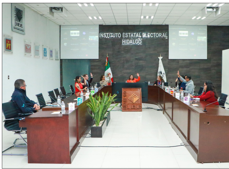
▲ El convenio fue aprobado por el Consejo General del Instituto Estatal Electoral (IEEH).

do 25 de octubre según los plazos establecidos en el calendario de actividades del Proceso Electoral Local Extraordinario 2024, y tras el cumplimiento de la documentación presentada ante el Consejo General del IEEH, quien determinó la procedencia de la candidatura común.