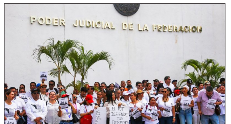
▲ Jueces y magistrados federales decidieron levantar la suspensión de actividades que mantienen vigente desde el pasado 21 de agosto.

La decisión de reanudar el trabajo también ocurre a una semana de que la Suprema Corte decidiera revisar la reforma judicial, pese a que no tiene reglas específicas para hacerlo