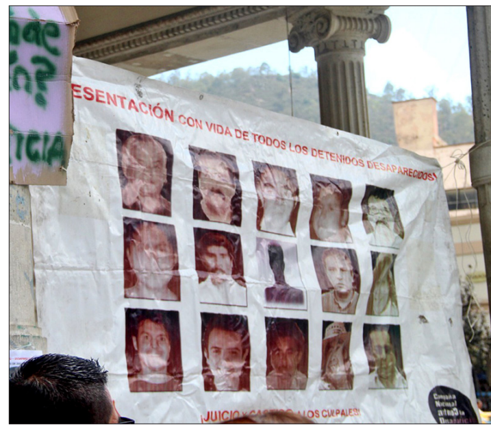
▲ De enero a lo que va de octubre de este año suman 253 casos; 2020 cerró con 80.

En lo que va del año, julio es el de más incidencias, con 40; le siguen septiembre, con 35, y agosto, con 31