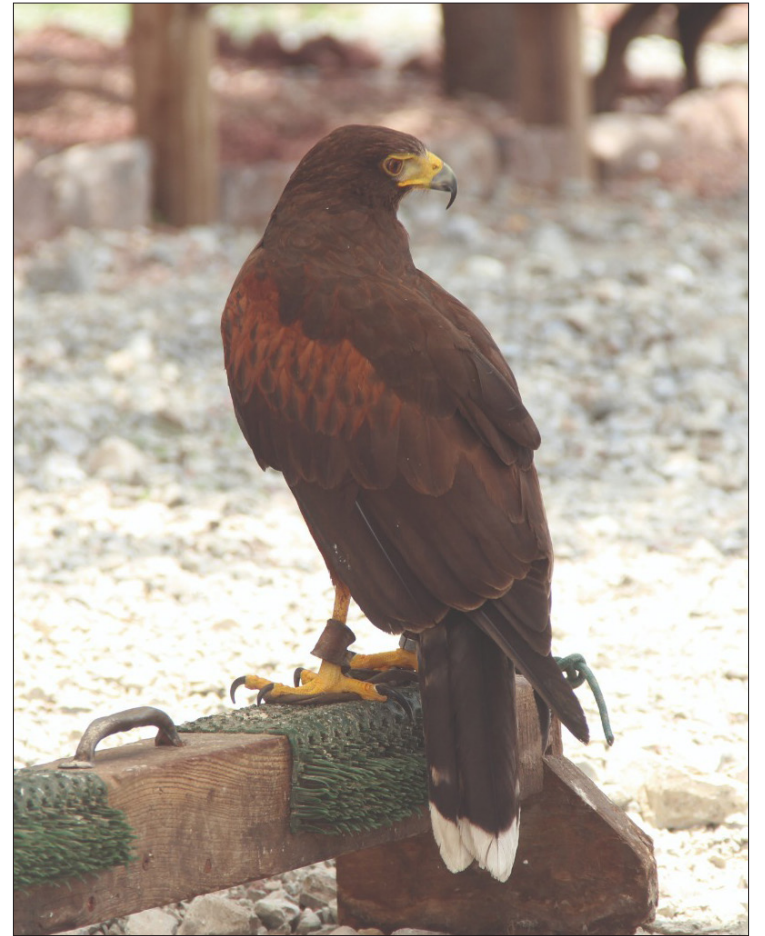
▲ La mayoría de los municipios no cuentan con reglamentos, lo que genera un desconocimiento en la protección de especies.

Comentaron que en Hidalgo se tienen grandes problemáticas sin atención por parte de las autoridades ambientales, como la contaminación de los ríos o la