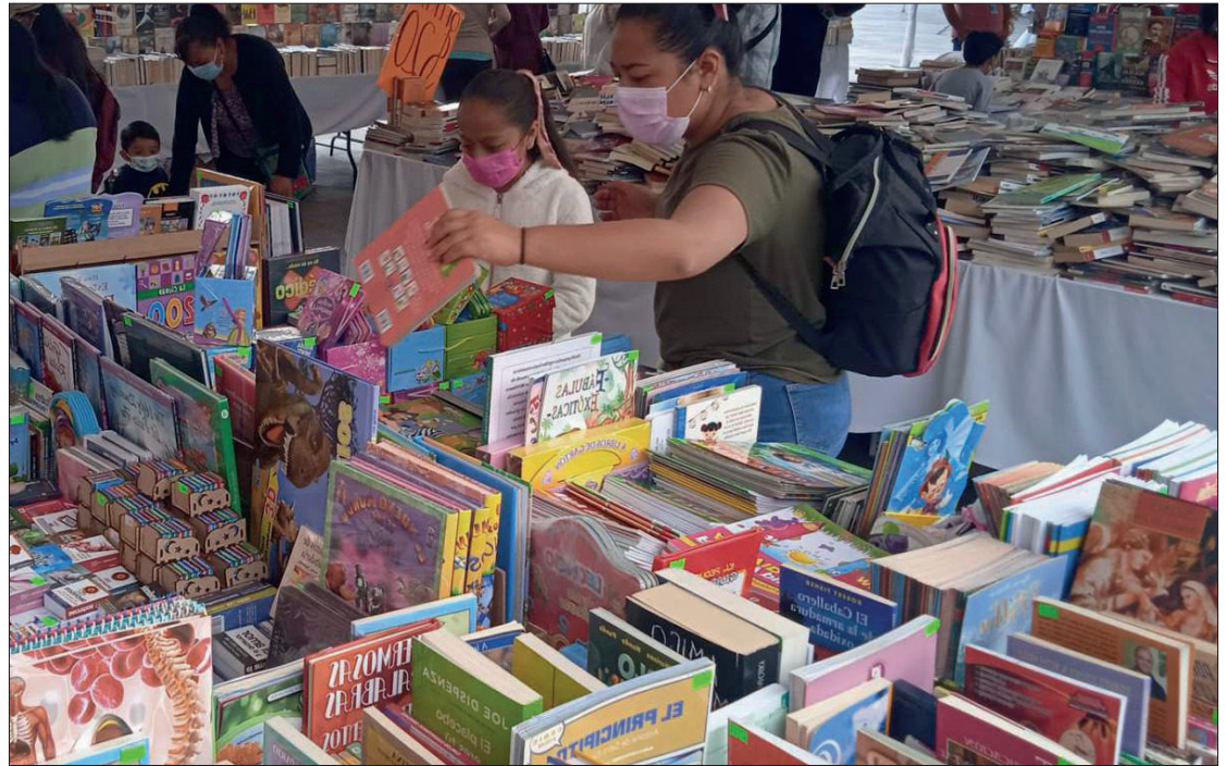
▲ El Centro Cultural del Ferrocarril, en Pachuca, es una de las seis sedes de la FERIA del Libro Infantil y Juvenil Hidalgo 2024.