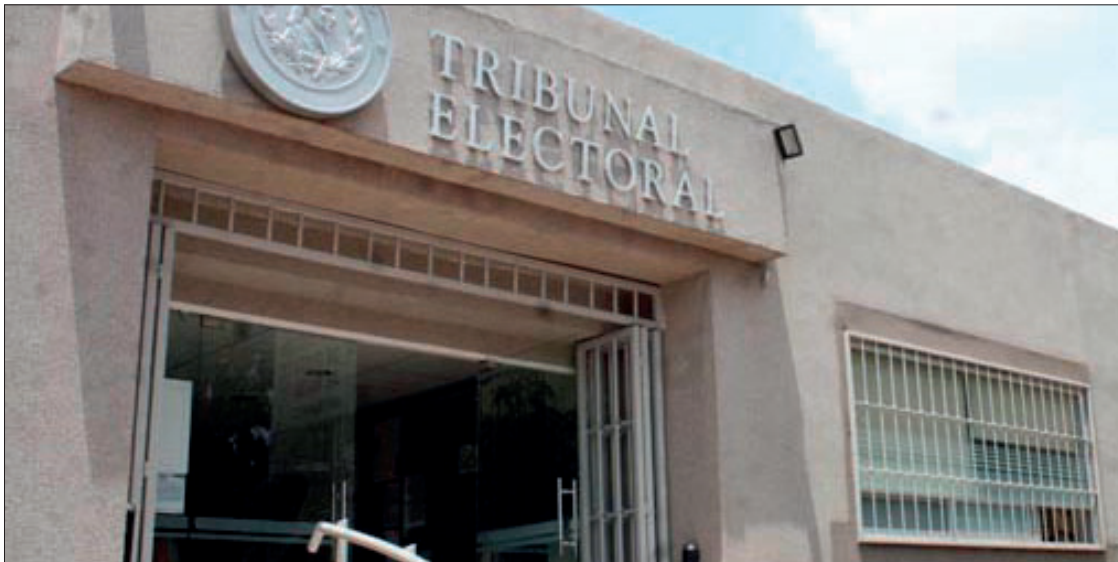
▲ Entre los casos que resolvió el Tribunal Electoral se encuentra el promovido contra la presidenta municipal de Tlaxcoapan.

RESOLVIÓ CONTROVERSIAS CONTRA AYUNTAMIENTOS