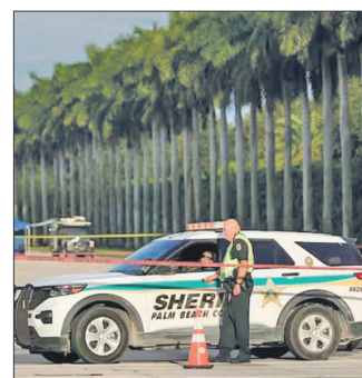
◀ La policía recuperó un rifle “estilo AK-47” equipado con mira telescópica.

Aproximadamente a las 13:30 locales, del pasado domingo, un agente del Servicio Secreto de