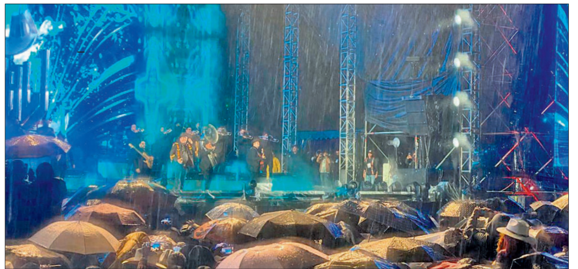
▲ Minutos antes de finalizar la última presentación, comenzó la lluvia que no impidió que los asistentes permanecieran en sus lugares.

El programa musical de “¡Viva Hidalgo! Tradición 2024” incluyó presentaciones de Macano, RWR Rockwell Road, la Zecta Norteña, Fascinación Orquesta, Banda Brizueña, un tributo al Divo de Juárez, mariachi, Los Sagahón y Grupo Cañaverl, quienes anima-