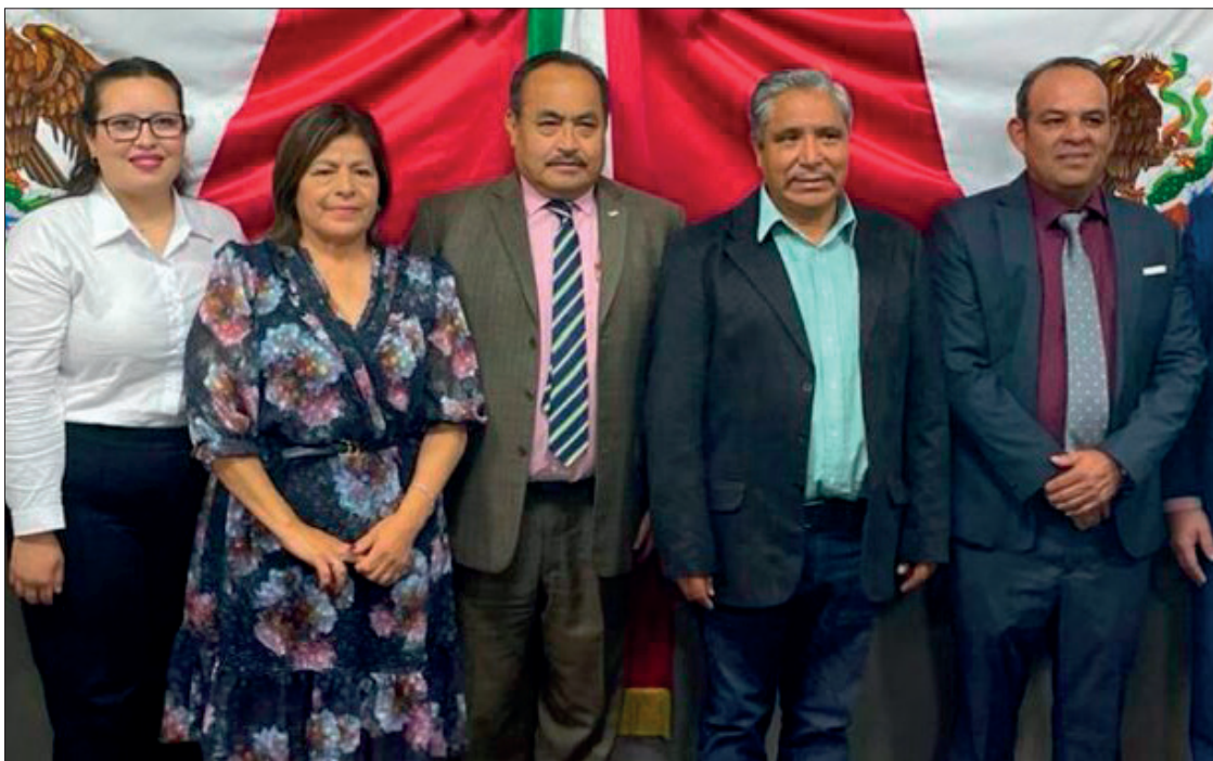
▲ Los ciudadanos que ahora integran el Concejo Municipal Interino asumirán todas las funciones administrativas y políticas.

LA DESTRUCCIÓN DE PAQUETES ELECTORALES PROVOCÓ LA ANULACIÓN