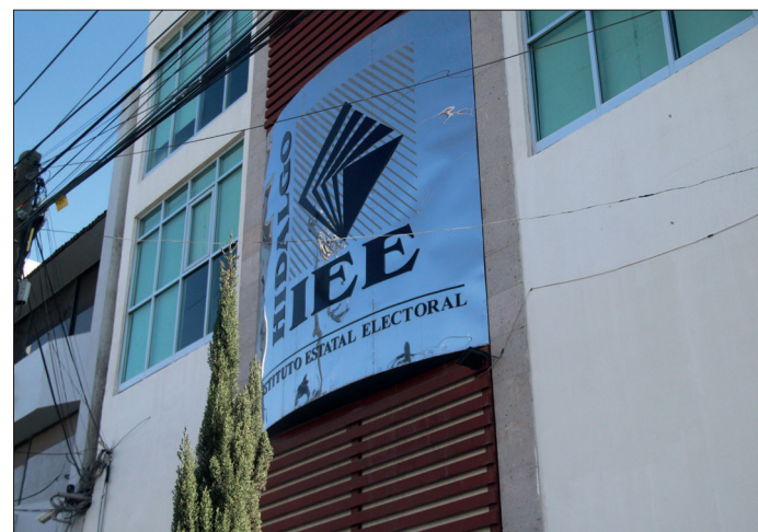
▲ El IEEH contará con un plazo de hasta 90 días para organizar los comicios en Cuauteppec.

Finalmente, adelantó que trabajarán en las mesas de seguridad con las dependencias estatales para garantizar el desarrollo de los comicios y la seguridad de las personas que integrarán las mesas directivas de casilla, para evitar que se repitan los actos de violencia en este municipio.