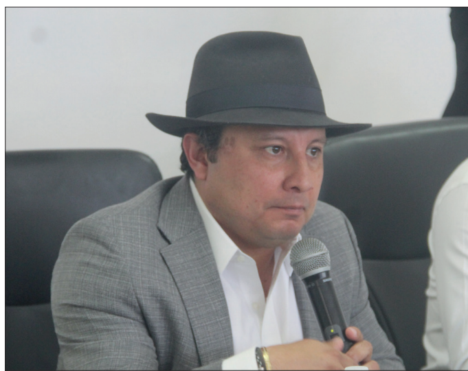
▲ El extitular del secretariado asegura que autoridades le niegan acceso a las denuncias presentadas en su contra.

quier orden de aprehensión, esta fue concedida para el sólo efecto de que las cosas permanezcan en el estado que actualmente guardan y no sea privado de su libertad personal con motivo de la orden de aprehensión y/o detención y/o retención y/o comparecencia y/o presentación y su eje-