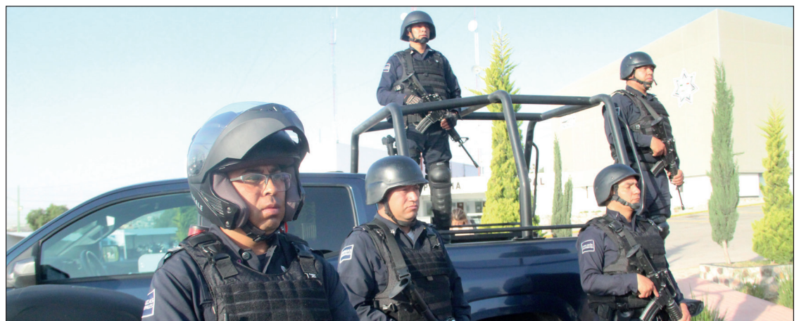
▲ Los fondos se destinarán a 36 de los 84 municipios y fueron presupuestados para el equipamiento del personal de las instituciones de seguridad pública y procuración de justicia.

En el primer semestre del año no se ha reportado el ejercicio del presupuesto