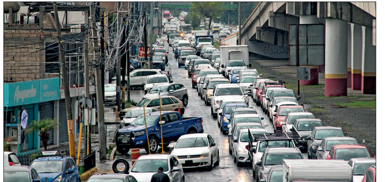
▲ Vialidades, casas y negocios sufrieron daños por los graves encharcamientos.