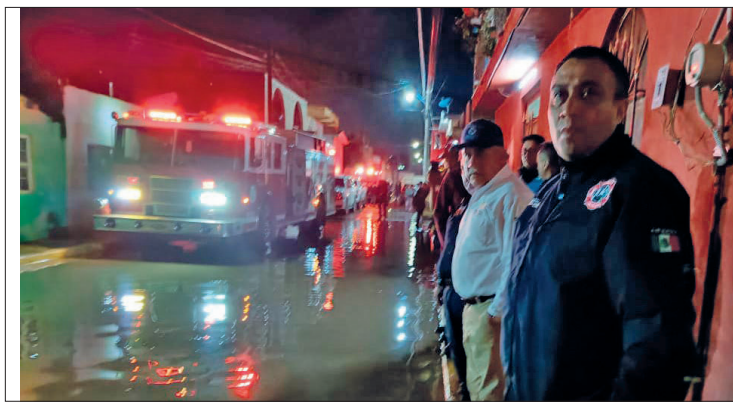
▲ La gente de Tula sigue tomando precauciones. Cada vez que el río crece, comienzan a sacar sus pertenencias de casas y negocios, como ocurrió la madrugada del 17 de septiembre.