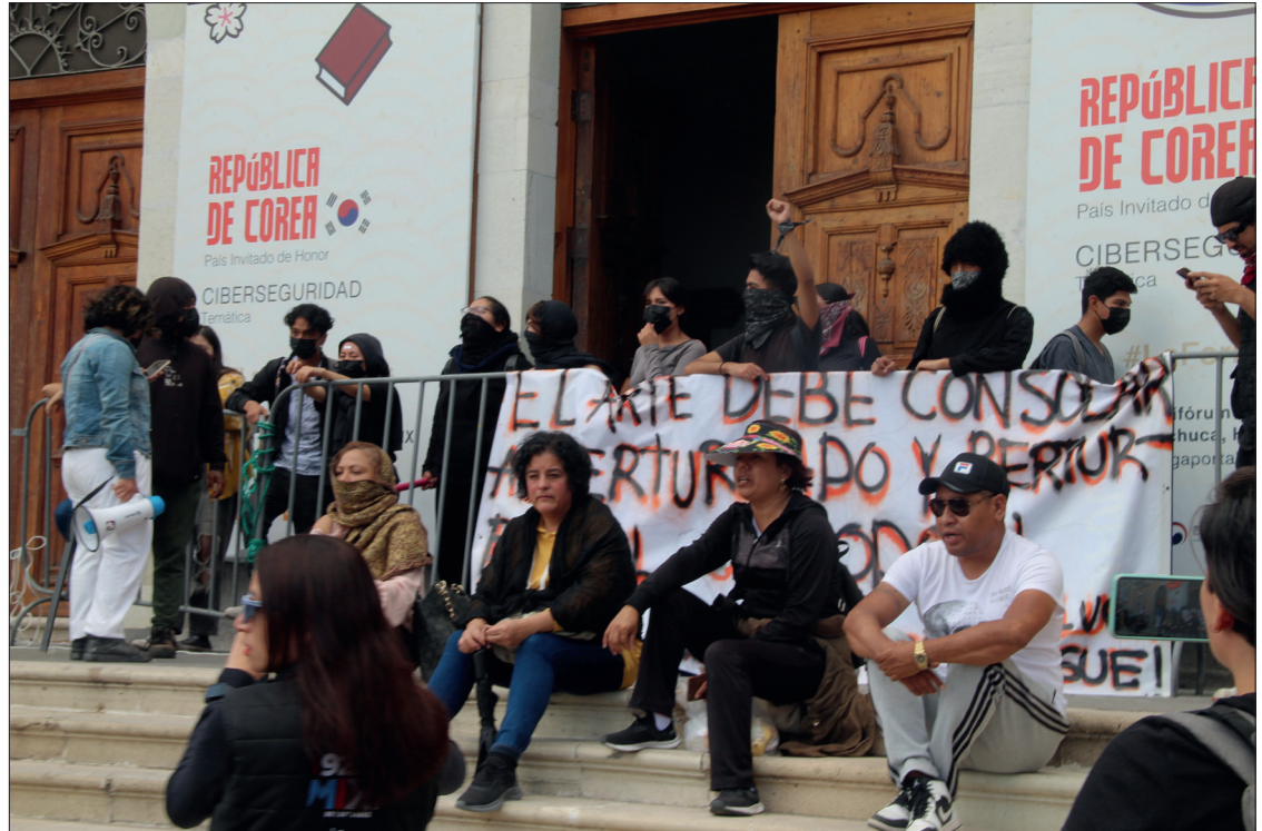
▲ Mañana se cumple el año de las agresiones contra el movimiento estudiantil del Instituto de Artes.

En lo que va de 2024, se registran nuevos motivos de queja: