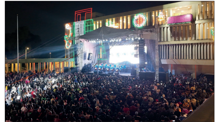
▲ La ciudadanía respondió con entusiasmo y disfrutó de las fiestas patrias en Tizayuca.

La ciudadanía respondió con entusiasmo y disfrutó del paso de los contingentes que en cada actividad que realizaron, afirmaban la unidad y el orgullo nacional.