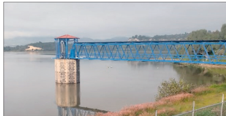
▲ Debido a las lluvias registradas, tres presas que la Conagua administra en la región del Valle de México superan su máximo nivel.

Según las observaciones del reporte, se han presentado dos der-