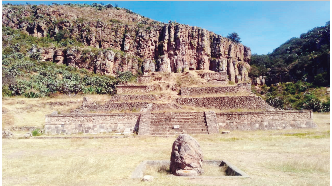
▲ Los miembros de la asociación civil aclararon que nunca ha sido su intención administrar Huapalcalco.

“Las autoridades federales, estatales y municipales, en el ámbito de su competencia, así como los particulares, podrán colaborar con el Instituto