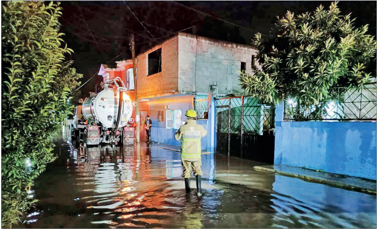
▲ La noche del 16 de septiembre, el río estaba prácticamente vacío a las 10:30 p. m., pero a las 12:10 a. m. el agua comenzó a salir por la compuerta. Aunque intentaron cerrarla, el agua se filtró por los drenajes.