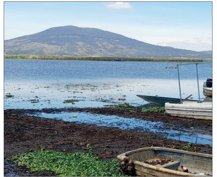
▲ El Servicio Geológico Mexicano tiene estudios sobre el subsuelo de la zona.

En ese sentido, precisó que concretar el centro de investigación no se va a resolver en un año, toda vez