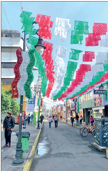
▲ Este año el festejo será en el Jardín La Floresta, en el centro de la ciudad.

El sábado se realizaron acciones como el retiro de agua de domicilios con bombas de achique y apoyo para lavar, destape y levantamiento de coladeras y rejillas, desazolve de coladeras y rejillas y retiro de basura y lodo, retiro de