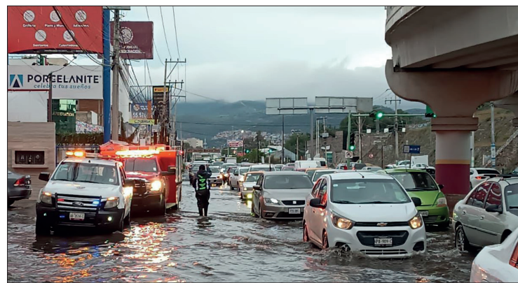
▲ La situación en las colonias de Pachuca durante las recientes lluvias “no fue tan grave” como en Mineral de la Reforma.