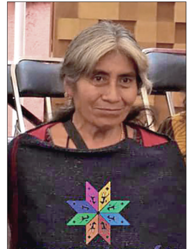
▲ La artesana textil nahua ha destacado en diversos concursos locales, estatales, nacionales e internacionales.

Obtuvo el primer lugar en el Concurso Nacional de Textiles y Rebozo 2019 en la categoría de textiles de algodón, enredos, fajas, tejido de cintura y pedal, participando con un traje completo.