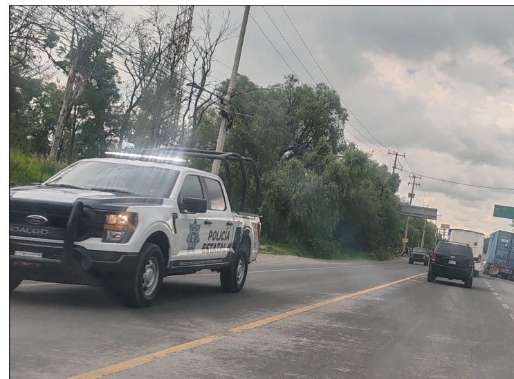
▲ El asalto sucedió a las 15:00 horas, al interior de la empresa Fibras Tepeji JDK, ubicada sobre la antigua carretera México-Querétaro.

Finalmente, se dijo que se logró recuperar parte del botín que se encontró en una mochila que llevaban los sospechosos, además, se sabe que otra parte del dinero está en otra mochila que presuntamente fue escondida por otros implicados y que ya se busca mediante un operativo.