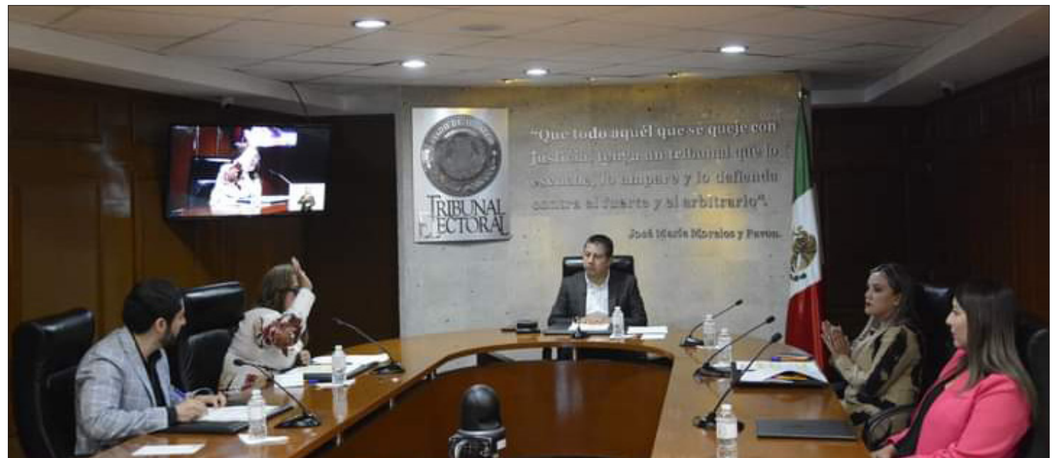
▲ Los magistrados dieron cumplimiento a lo ordenado por la Sala Regional Ciudad de México del Tribunal Electoral del Poder Judicial de la Federación.

Certificado de Reserva otor- gado por el Instituto Nacional del Derecho de Autor: 04- 2021-080217242200-101