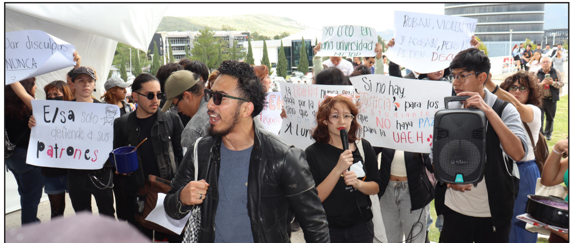
▲ Los inconformes exigen que se acepte la recomendación de la Comisión de Derechos Humanos del Estado acerca de los actos de violencia que vivieron integrantes de la comunidad estudiantil el 19 de septiembre de 2023.