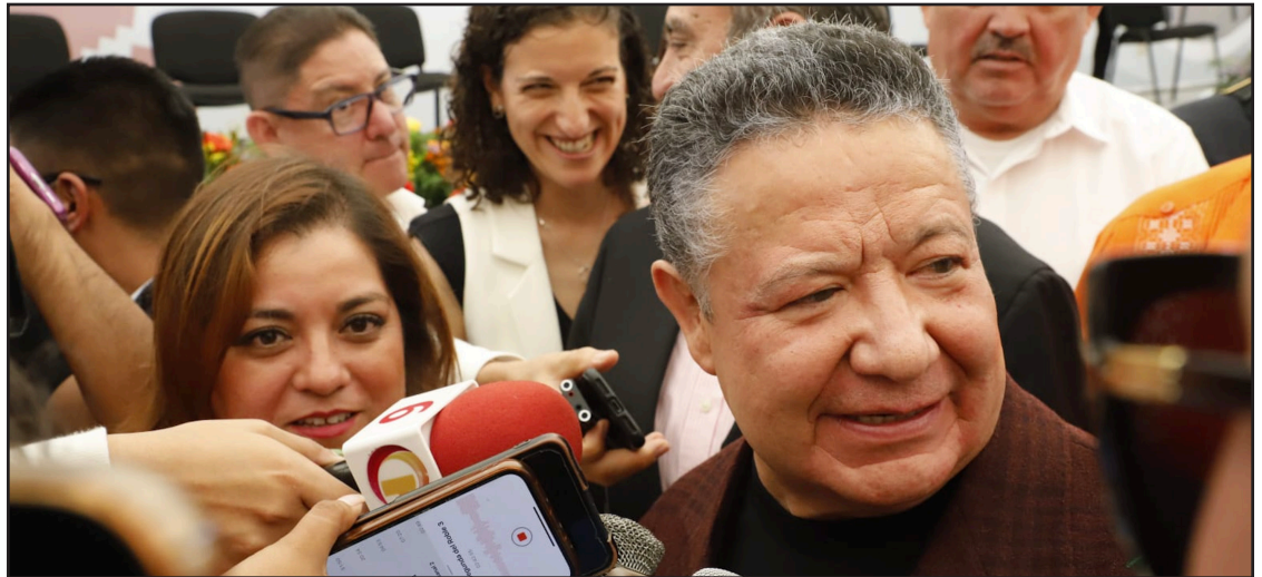
▲ El mandatario señaló que las declaraciones del embajador de EU fueron inoportunas y reflejaron una falta de diplomacia, especialmente porque en el país vecino también se eligen jueces mediante voto popular. Foto Cortesía

Esto, al referirse que se le hicieron cerca de 100 modificaciones a la propuesta original enviada por el