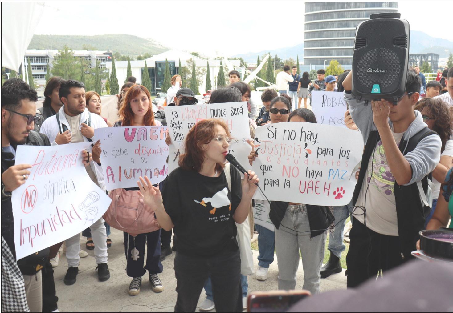
▲ Durante la concentración, los estudiantes gritaron consignas en contra de la casa de estudios en el acceso principal de la Feria Universitaria del Libro.

SÁBADO 24 DE AGOSTO DE 2024 HIDALGO // AÑO 4 NÚMERO 1169 // Precio 10 pesos