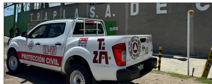
▲ El cuerpo fue trasladado a la Fiscalía General de Justicia del Estado de México para la realización de la necropsia de ley.

Henkel dijo que las empresas están obligadas a permitir el acceso a los servicios de emergencia, por lo que "seguramente habrá repercusiones [...] en caso de que hayan incurrido en alguna falta y al no permitir el acceso tendrán que presentar cuentas y tendrá que haber una auditoría de parte de las autoridades competentes".