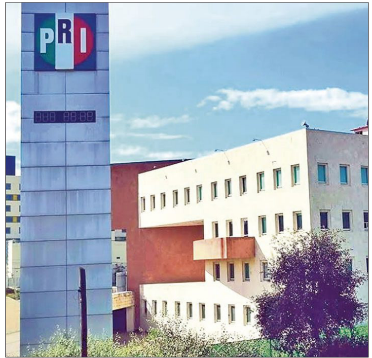
▲ El grupo de priistas inconformes exige respeto a las normas electorales.