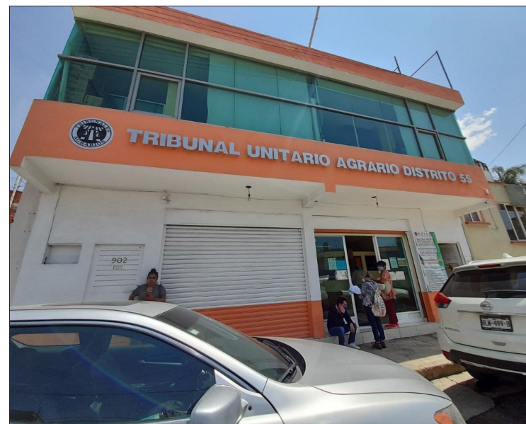
▲ Hidalgo es el cuarto lugar con más asuntos recibidos en Tribunales Unitarios: mil 623 en el Distrito D55 y 827 en el Distrito D14.

Señala que, en contraste con 2022, el presupuesto del Tribunal Superior Agrario y de los Tribunales Unitarios Agrarios aumentó 18.6 y 0.9 por ciento, respectivamente, en 2023.