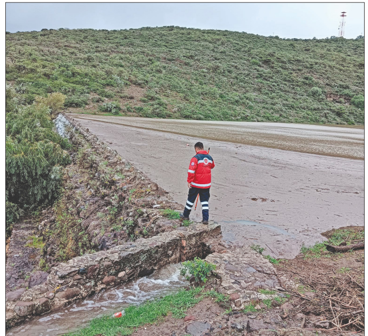
▲Debido a las intensas lluvias ha habido desbordamiento de ríos y comunidades incomunicadas.

Por otra parte, de acuerdo con la Subsecretaría de Protección Civil, del 30 de junio al 4 de julio, además de 36 municipios, resultaron afectadas nueve escuelas, 442 viviendas, 25 carreteras, dos hospitales, hubo un fallecido, comunidades afectadas, cuatro incomunicadas y cuatro sin energía eléctrica.