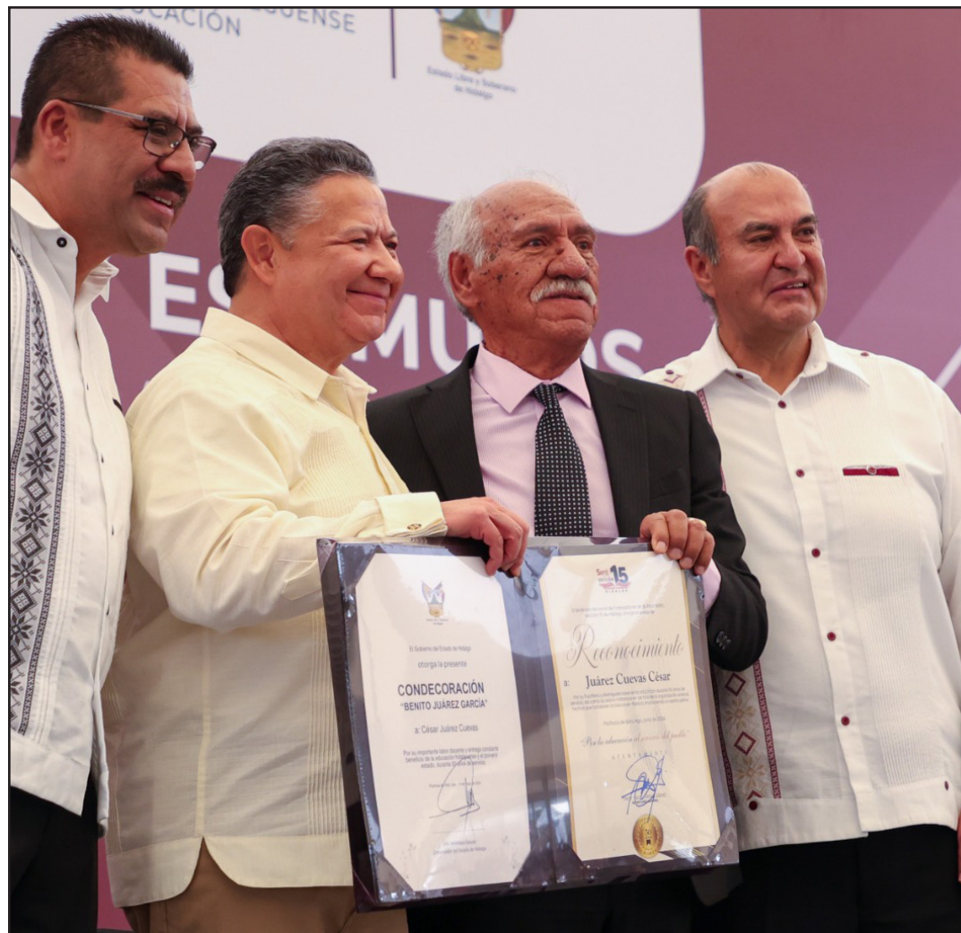
▲ Destacaron el profesionalismo de los 2 mil 077 docentes que se dedican a la formación de niñas y niños.

Certificado de Reserva otorgado por el Instituto Nacional del Derecho de Autor: 04-2021-080217242200-101