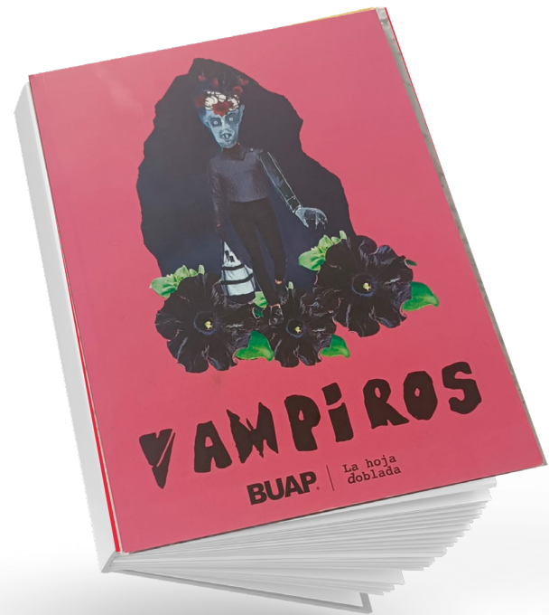
▲ En este libro se mezclan los sentidos, se huele la tinta, como si fuera sangre, en cada dibujo, en cada letra, en cada colmillo.