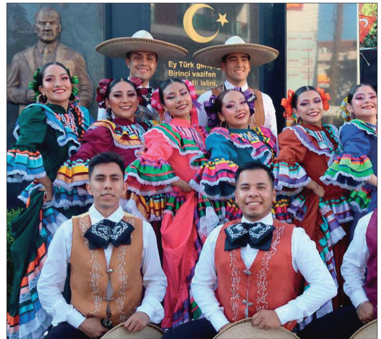
▲ El ballet folclórico está conformado, en su mayoría, por alumnos y exalumnos del CBTIS 200, ubicado en la colonia Tlaxinacalpan. Además, los acompaña una cantante de música regional mexicana.

Forman parte del Festival Internacional de Folklore “Uluslararası Halk Dansları Festivali’ne Hoş Geldiniz”