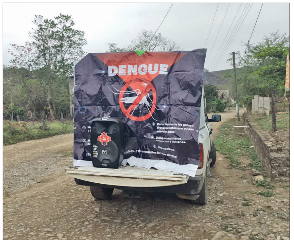
▲ La Secretaría de Salud de Hidalgo (SSH) implementa la campaña "Lava, tapa, voltea y elimina".

La situación se ha exacerbado luego del paso de las tormentas Alberto y Chris por territorio nacional