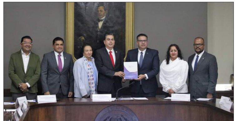
▲ Entre los municipios con los mayores montos destacan Pachuca con 6 millones 714 mil 760.82 pesos, Huejutla de Reyes con 4 millones 320 mil 058.04 pesos y Tepeji del Río con 2 millones 064 mil 904.05 pesos.

Mientras que de los organismos descentralizados municipales los cinco entes con mayor importe pendiente por solventar son: la Comisión de Agua del Municipio de Huasca con 2 millones 219 mil 721.85 pesos, el Instituto Municipal para la Prevención de Adicciones con 1 millón 643 mil 906.24 pesos, así como el Organismo Operador de Agua Potable del Aserradero con 972 mil 194.72 pesos. Finalmente, se dio a conocer que,