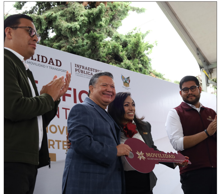
▲ Este viernes, el gobernador, Julio Menchaca Salazar, hizo entrega simbólica de las llaves a la titular de la dependencia, Lizbeth Robles Gutiérrez.

“En los próximos meses de julio y agosto estas oficinas serán equipadas con equipo de cómputo y sistemas de videovigilancia, lo anterior gracias a una inversión de 7 millones 887 mil 685 pesos, esto fue sin solicitar recursos extraordinarios”, detalló Ángeles Pérez.