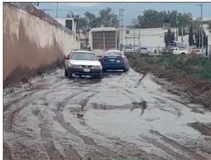
▲ La ciudadanía demanda la rehabilitación de estos caminos rurales deteriorados.

"No queremos que se asfalte, solamente tezontle, cascajo, lo que sea, pero que sea una vialidad más digna, pagamos impuestos y no tenemos el trato que ellos exigen al momento de pagar", agregó.