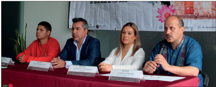
▲ Preparan actividades artísticas, deportivas y religiosas, así como atractivos como pinturas rupestres y paisajes únicos.

Al tomar la palabra, el coordinador de Deportes municipal, Azael López Durán, explicó que una de las actividades que están impulsando es la carrera atlética. Cada año esta carrera cobra un significado relevante, ya que recibe a participantes de diferentes municipios y otras entidades, convirtiéndose en una convivencia muy interesante y una gran oportunidad para apreciar la naturaleza, ya que se realiza en un circuito por la vega de Metztitlán.