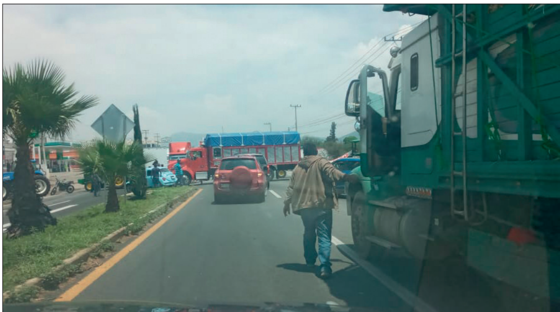
▲ Este movimiento se suma al cierre que los inconformes mantienen desde el martes.