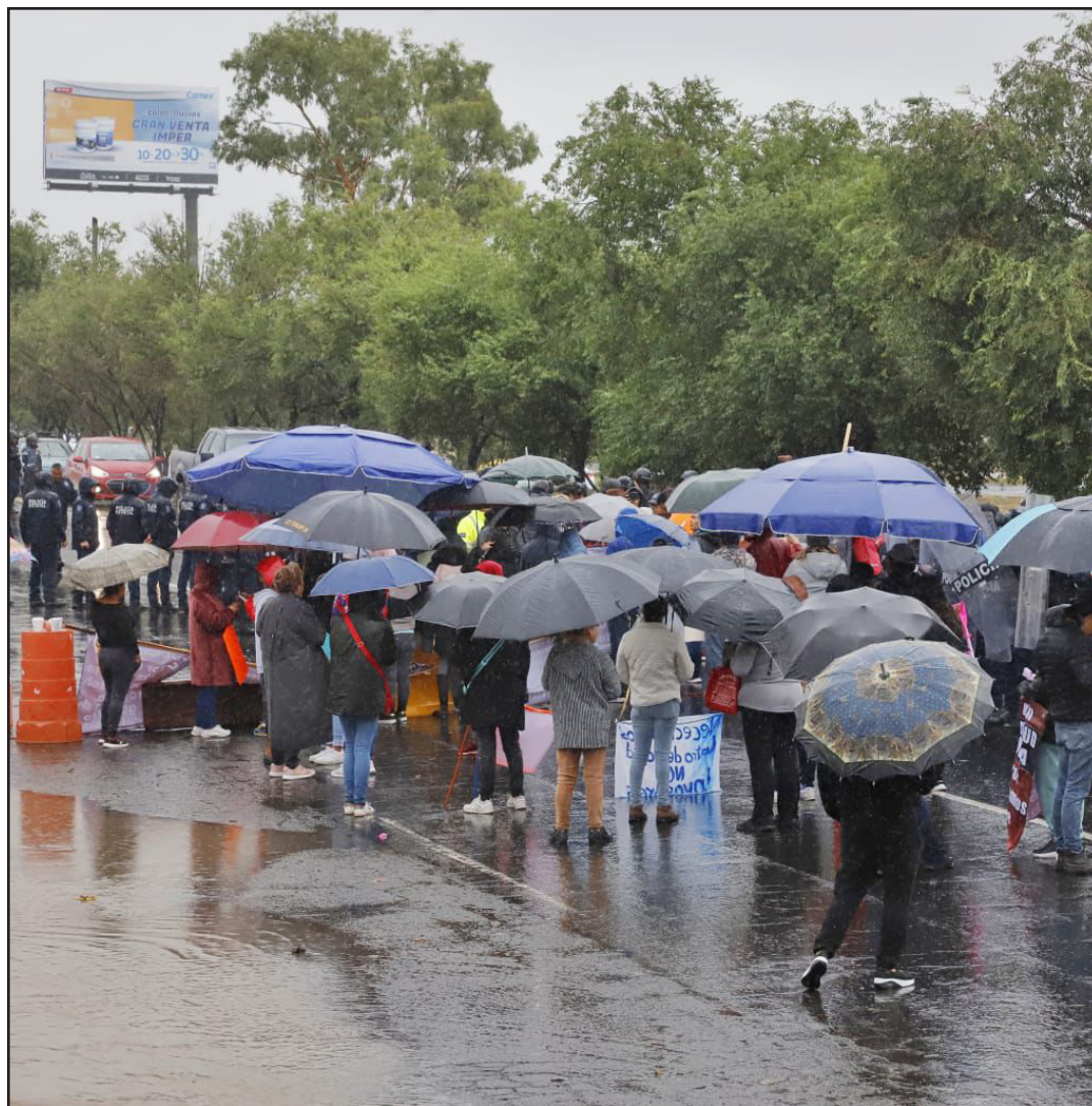
▲ Los afectados bloquearon la vialidad, pues aseguran que el Gobierno Estatal no busca darles solución pese a la actitud agresiva que han mostrado los invasores.

Certificado de Reserva otorgado por el Instituto Nacional del Derecho de Autor : 04-2021-080217242200-101