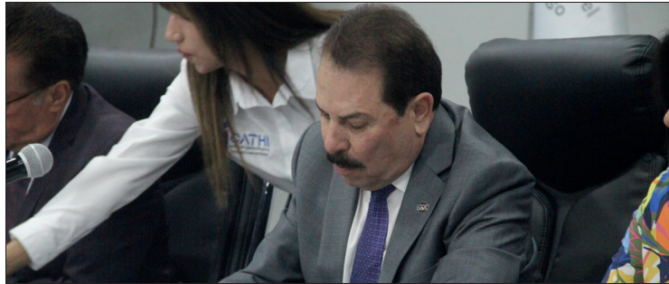
▲ El presidente del CCEH lamentó que “ya estamos invadidos de ese tipo de negocios”.