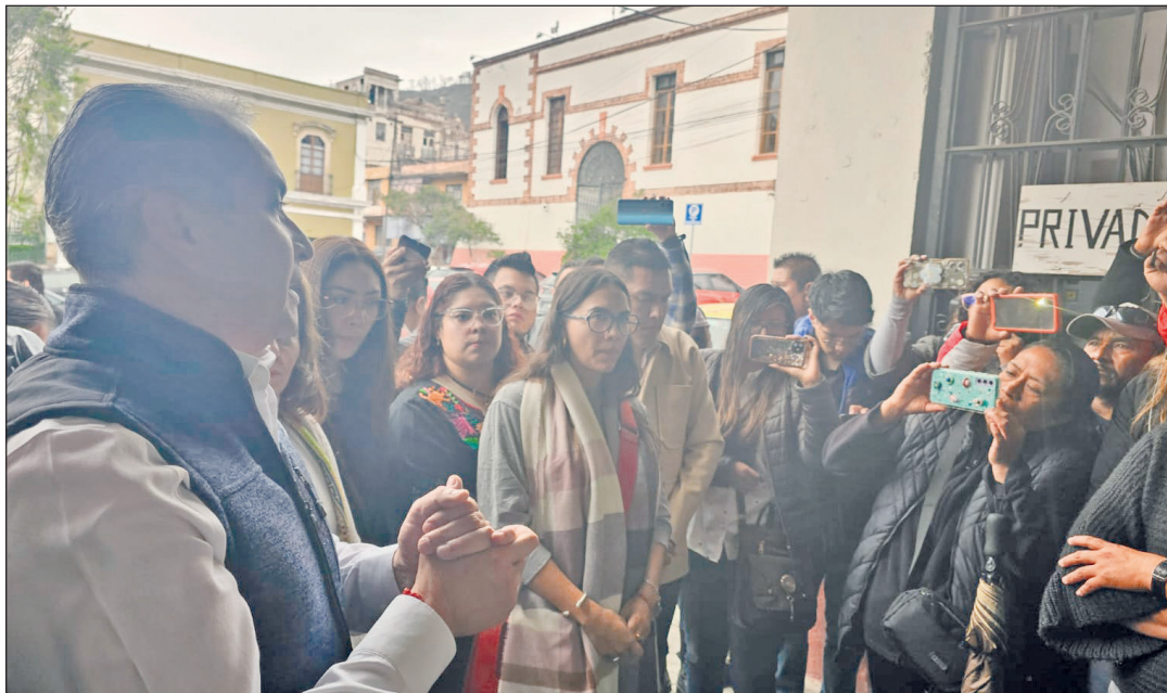
◀ Dijeron que sería "muy loable" que esta administración municipal condone el pago.

Buscan que la Comisión de Hacienda realice este trámite para tener seguridad de sus escrituras