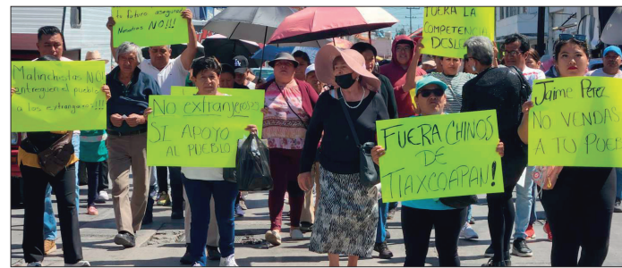
▲ La manifestación inició con una caravana que recorrió las principales calles del municipio de Tlaxcoapan.

Hasta el momento, las autoridades municipales no han emitido una declaración oficial sobre la situación.