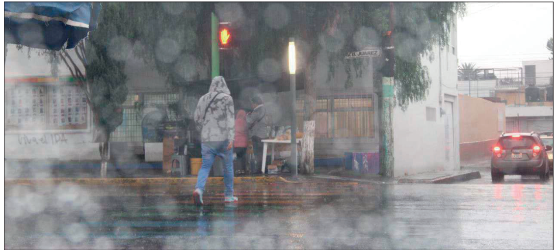
▲La cuestión climatológica es una situación que viene desde Sudamérica por un cúmulo de vapor de agua “sumamente intenso”, explicó el presidente municipal.

Exhortó a la ciudadanía a tomar precauciones y a no tirar la basura en la calle o los drenes para que no se tapen las coladeras.