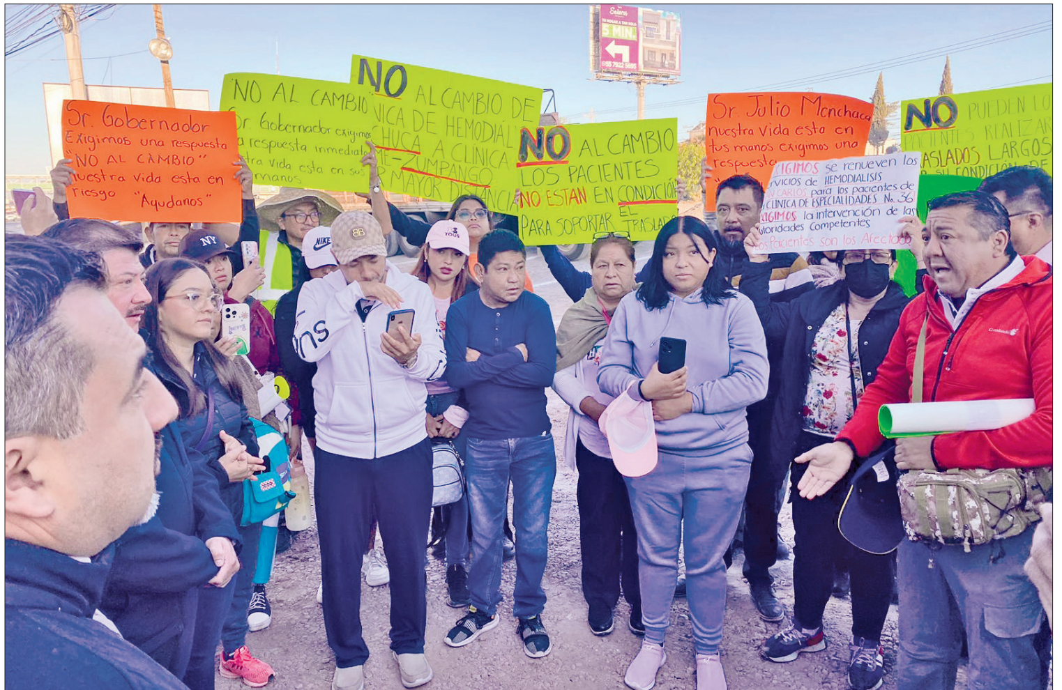
▲ La protesta comenzó a las 6 de la mañana, causando caos vial. Los inconformes levantaron el bloqueo poco después de las 10:00 horas.