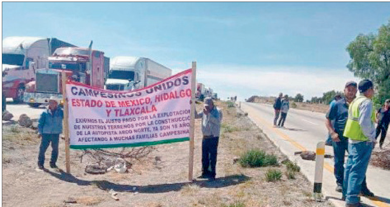
▲ “Exigimos el justo pago por la explotación de nuestros terrenos por la construcción de la autopista Arco Norte, ya son 18 años afectando a muchas familias campesinas”, decía una de las mantas que expusieron los inconformes.

Interrumpieron la circulación en ambos sentidos