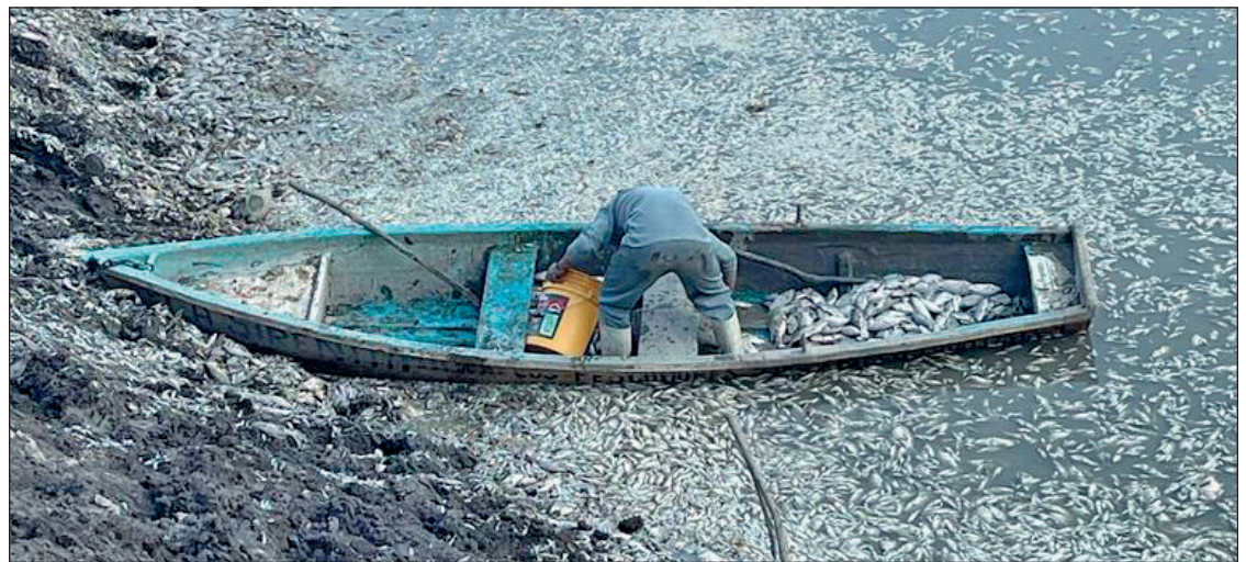
▲ Actualmente Hidalgo se enfrenta a la más grave de las sequías en las presas, por lo que se han observado a especies de peces morir, como es el caso de Requena y otros embalses.

Se han observado a especies de peces morir, como es el caso de Requena y otros embalses, en los que piscicultores han solicitado el apoyo a los diferentes niveles