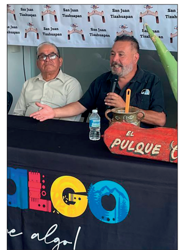
▲ Los organizadores dieron los detalles de esta fiesta en rueda de prensa que tuvo lugar en la Secretaría de Turismo estatal.

Informaron que hay una leyenda en este pueblo que data de 1920, que indica que los tlachiqueros o arrieros pasaban por el cerro de Tenango, donde aparentemente hay un portal; se cuenta que el día de San Juan es cuando se abre y se puede ver una gran feria, en la que no es recomendable comer o beber nada, quienes así lo hacen se convierten en piedra y forman parte del paisaje.