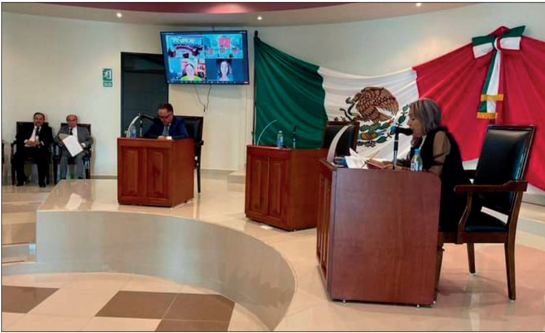
▲ Los integrantes de la asamblea, mediante un escrito individual, renunciaron a ese derecho que establece la Ley Orgánica Municipal.