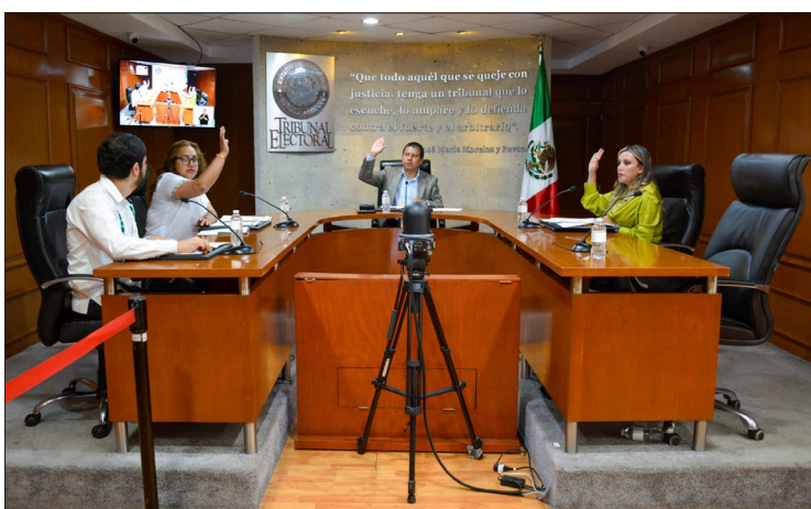
▲ En sesión pública, los magistrados coincidieron en que el alcalde con licencia infringió la norma electoral.