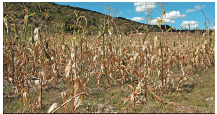
▲ Hidalgo continúa como la entidad con más territorios donde es probable una situación de emergencia debido a la ausencia de agua.

Según el informe de la fuente federal, la presencia de una circu-