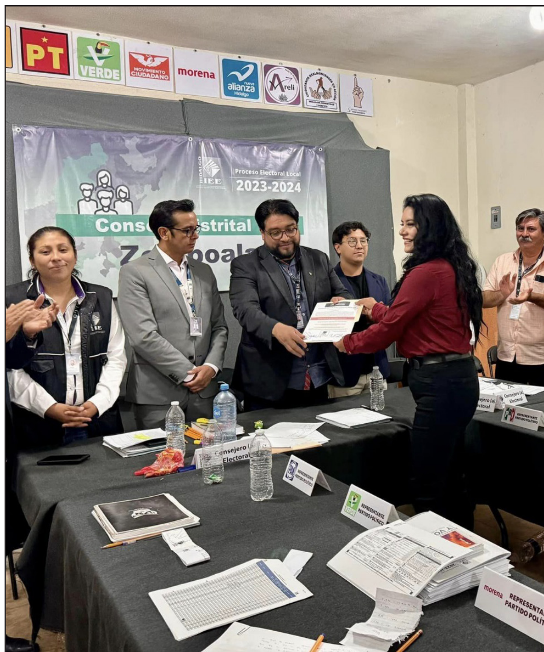
▲ Respecto a la entrega de constancias de mayoría a quienes obtuvieron una diputación local, se dio a conocer que ya se tiene un avance del 66 por ciento.

Certificado de Reserva otorgado por el Instituto Nacional del Derecho de Autor: 04-2021-080217242200-101