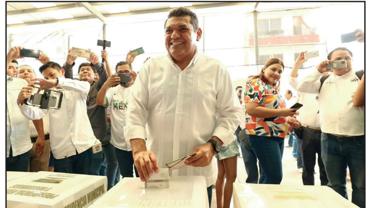
▲ En Tabasco, el abanderado Javier May, de la coalición Sigamos Haciendo Historia, arrasaba con el 82.83%.