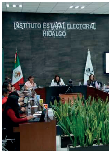
▲ De no cumplir con todos los requisitos, sus registros serían anulados.

Cerca de las siete de la mañana del 2 de junio y previo al arranque de la jornada electoral, el Consejo General