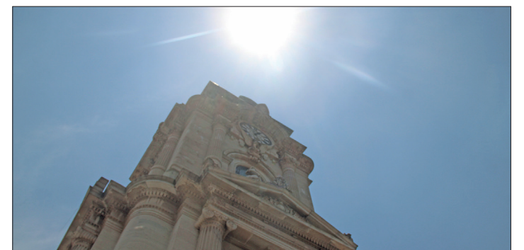
▲ El aire contaminado de polvo hace que “las vías respiratorias se empiecen a inflamar y a dificultar la respiración”.

El director agregó que lo mismo sucede con el enfisema pulmonar que también se complica en esta temporada.