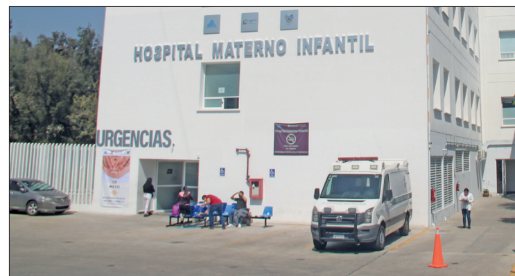
► Se registraron un total de 476 casos de Morbilidad Materna Extremadamente Grave.

Hidalgo registra una razón de Morbilidad Materna Extremadamente Grave de 10.1 por cada 100 mil nacidos vivos. La media nacion-