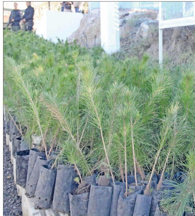
► De acuerdo con los silvicultores, tal actividad será importante debido a las fuertes olas de calor y las condiciones de sequía extrema y excepcional.

Para este mismo día se realizará la reposición de especies removidas con ejemplares de trueno, sangre libanesa y falso laurel.