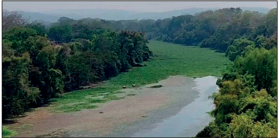
▲ De enero a marzo de 2024 se han otorgado 13 concesiones para 11 municipios: Zimapán, Tepehuacán de Guerrero, Tizayuca, San Salvador, San Agustín Metzquititlán, Alfajayucan, Acatlán, Metztlán, Ixmiquilpan, San Bartolo Tutotepec y Huejutla.

Mientras que para uso agrícola la Conagua otorgó nueve títulos o permisos para extracción de aguas nacio-