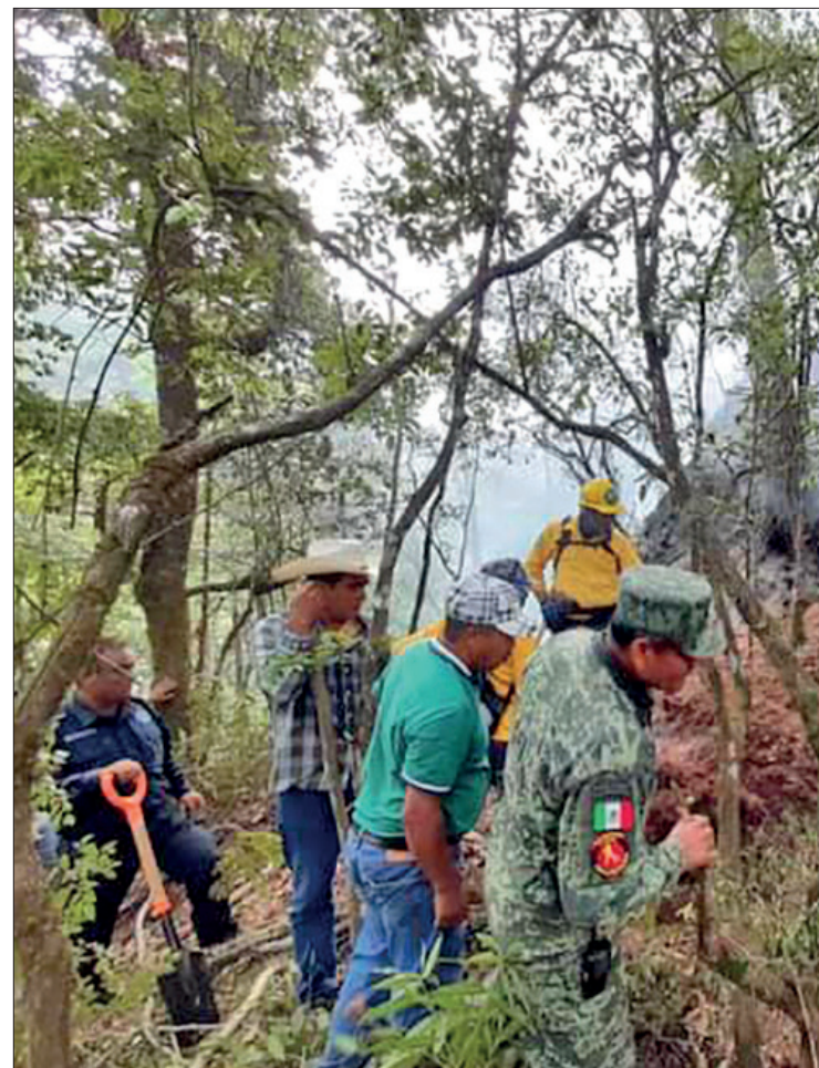
► En este tipo de vegetación los incendios suelen presentarse cada varios siglos cuando hay sequía extrema, pero resultan ser catastróficos.

De acuerdo con la Conafor, en este tipo de vegetación los incendios suelen presentarse cada varios siglos cuando hay sequía extrema, pero resultan ser catastróficos. La recuperación (de forma natural) de la vegetación original puede tardar cientos de años.