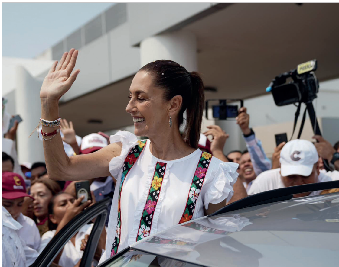
▲ Al cierre de las campañas, Claudia Sheinbaum llega con un apoyo prácticamente inalterado, reflejando una estabilidad en su base electoral.

Las campañas terminan el miércoles 29 de mayo, dando paso a un periodo de reflexión antes de la jornada del 2 de julio, cuando los ciudadanos acudirán a las urnas para elegir a la próxima presidenta de la República.