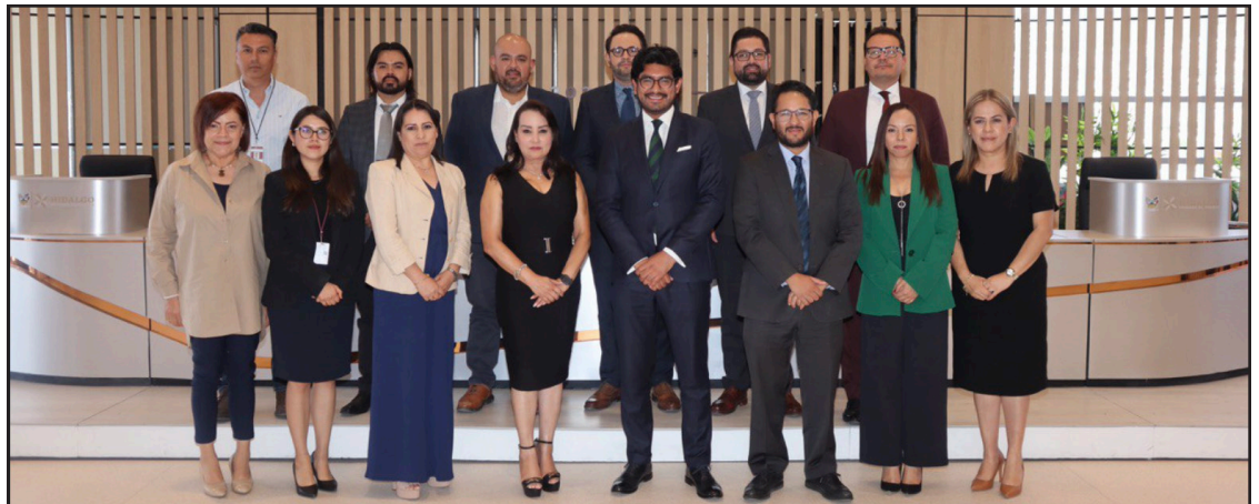
▲ Por segundo año consecutivo, la agencia internacional aumentó la calificación; esta alza atiende a la mejora de la posición financiera de la entidad.

Otro punto que resaltó es la mejora en la sostenibilidad de la deuda pública, que implica estabilidad financiera para el cumplimiento de todas las obligaciones de pago actuales y futuras, como el pago anticipado de uno de los cinco financiamientos de la deuda pública que realizó el gobierno, el pasado 11 de