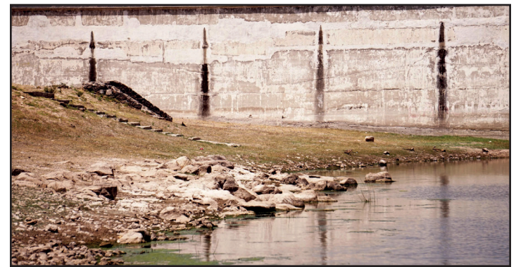
▲ Las presas que administra Conagua en el Valle de México se encuentran al 35.3% de almacenamiento global.

Se espera que la temporada de lluvias 2024 ayude a aumentar los niveles de las presas, ya que las últimas precipitaciones poco han aportado, ante una intensa ola de calor.