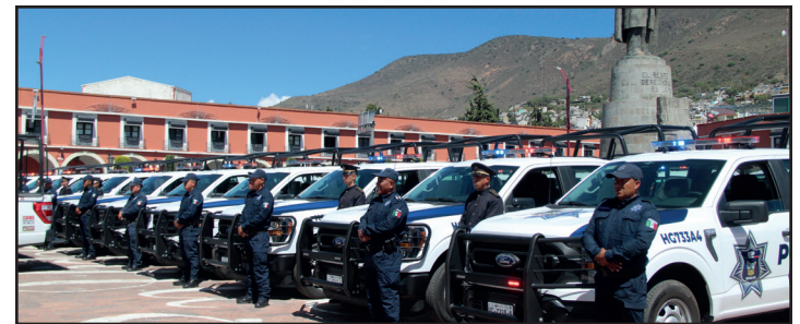
▲ Habrá un anuncio previo a la elección de cuántos serán los elementos de todas las corporaciones y su distribución.

En cuanto a la granizada que se tuvo en la zona metropolitana, dijo que ya se puso en contacto con el presidente municipal para ver de qué manera van a apoyar a las personas afectadas.