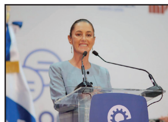
▲ Claudia Sheinbaum tuvo un encuentro con empresarios de Nuevo León. Álvarez Máynez detalló que tuvo una reunión de evaluación en el Hospital Universitario. Xóchitl Gálvez acudió a un mitin en la alcaldía Cuauhtémoc.

"En solidaridad con lo acontecido esta noche en el evento de Movimiento Ciudadano en San Pedro, Nuevo León. Hemos decidido cancelar el mitin programado para mañana a