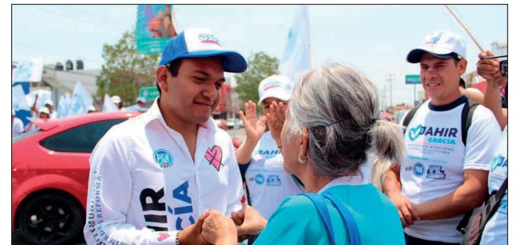
▲ El candidato a alcalde propuso impulsar actividades ocupacionales y recreativas para mejorar su calidad de vida.

Durante su encuentro con adultos mayores, habitantes de Mineral de la Reforma expresaron su aprobación de que un candidato joven busque la alcaldía.