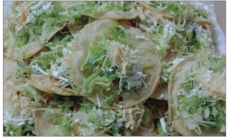
▲ Su elaboración artesanal pone de manifiesto las técnicas, conocimientos y tradiciones de la región.

Regidores resaltaron la importancia cultural y gastronómica del platillo