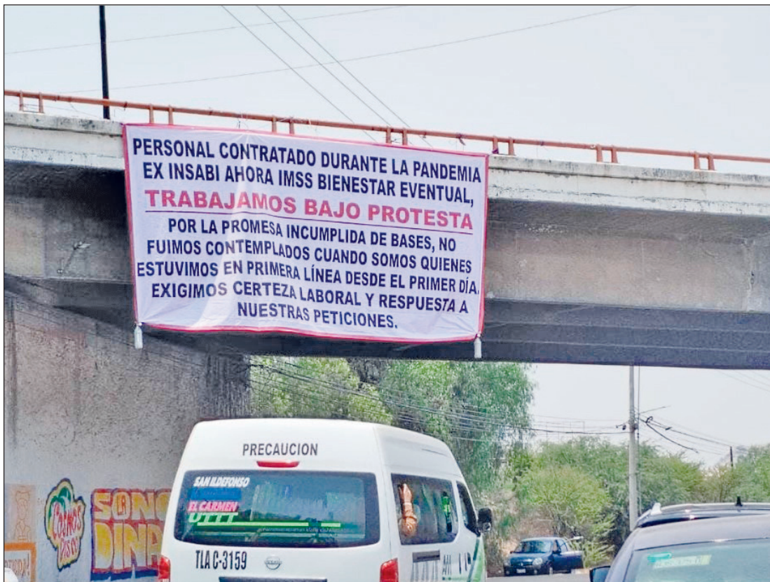
◀ Los inconformes advirtieron que trabajan bajo protesta. Foto Especial

La manifestación fue encabezada por el personal contratado durante la pandemia