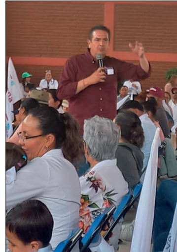
▲ El aspirante de Morena y Nueva Alianza reconoció que es imposible que con 16 patrullas se atiendan a 32 comunidades y más de 44 fraccionamientos.