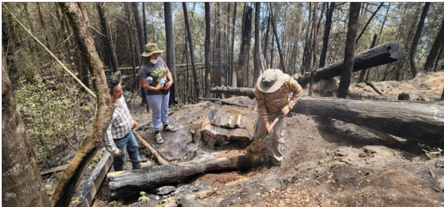
EL AYUNTAMIENTO DETALLÓ QUE SE MANTENDRÁ LA VIGILANCIA