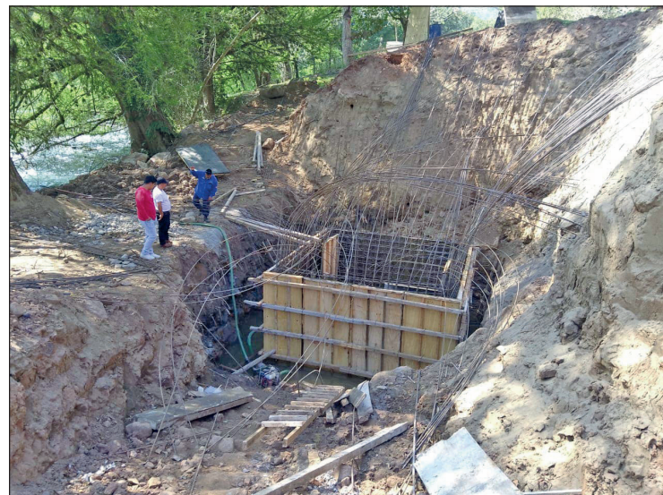
▲ La empresa responsable de la obra ha confirmado los hechos y ha revelado que los trabajadores fallecidos eran originarios de Jaltocán.

Con las temperaturas en la región superando los niveles normales, las autoridades han emitido alertas de salud, instando a la población a mantenerse hidratada y limitar la exposición al sol. Ante la persistencia de la ola de calor, se recomienda estar al tanto de las actualizaciones meteorológicas y adoptar las