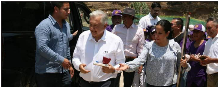
◀ El presidente de México, Andrés Manuel López Obrador, acompañado del gobernador de Hidalgo, Julio Menchaca Salazar, supervisó este viernes al medio día el avance de la construcción.

Es una inversión que rebasa los 7 mil millones de pesos, junto con la otra ampliación, dijo el gobernador