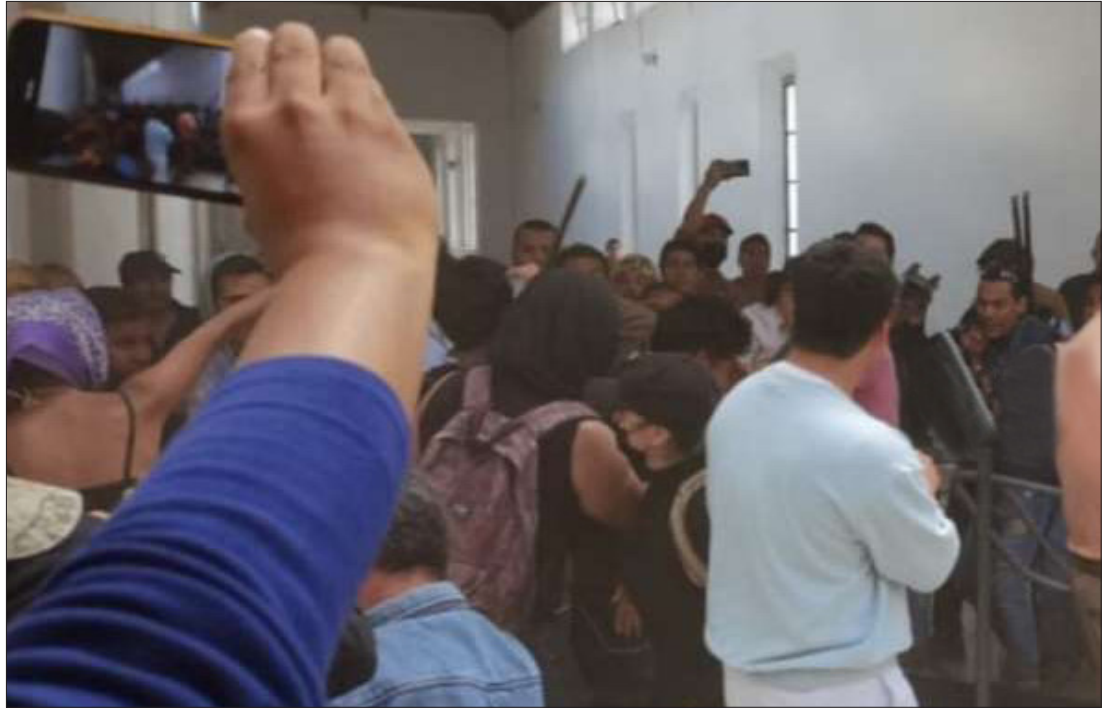
▲ Durante la continuación de la audiencia inicial, se estableció que había pruebas suficientes para vincularlo a proceso, y se determinan tres meses de investigación complementaria.

El conflicto estudiantil continuó hasta la ex sede de rectoría donde personal de la UAEH, incluido el ex líder del Consejo Estudiantil, Esteban Rodríguez Dávila, reprimió con palos y gases la protesta de los estudiantes de artes.